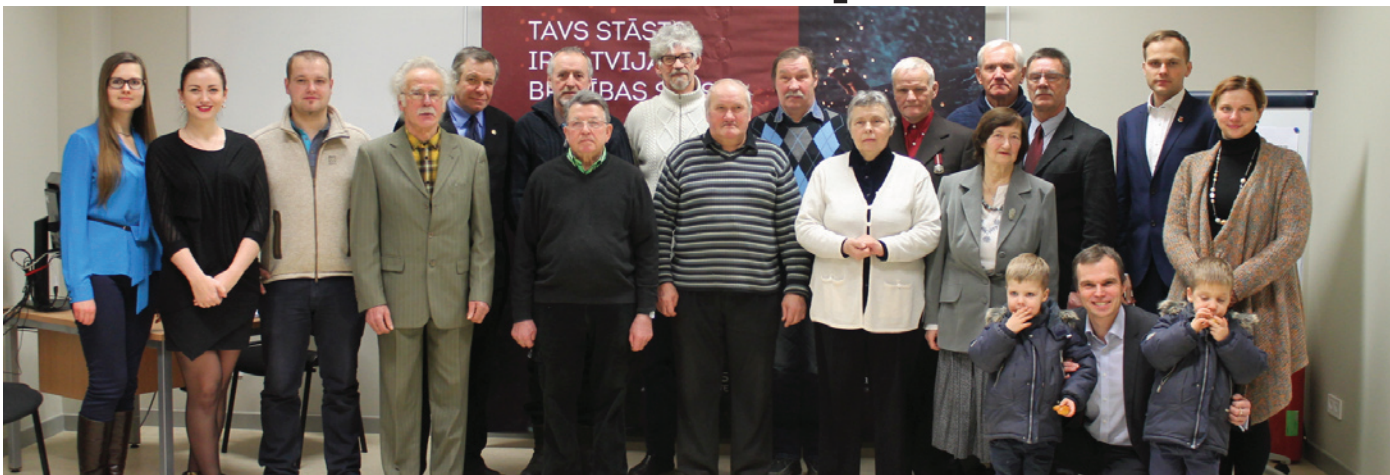
Barikāžu atceres pasākuma dalībnieki un organizatori