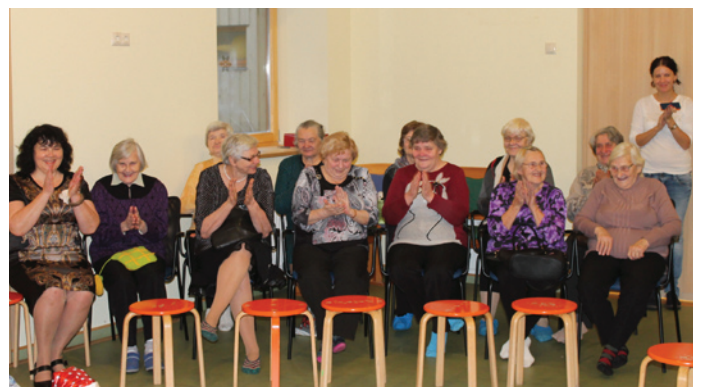
Koncerta skatītājos valda prieks un smaids