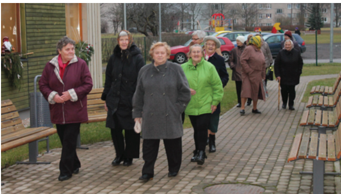
PII "Krimulda" ierodas viesi