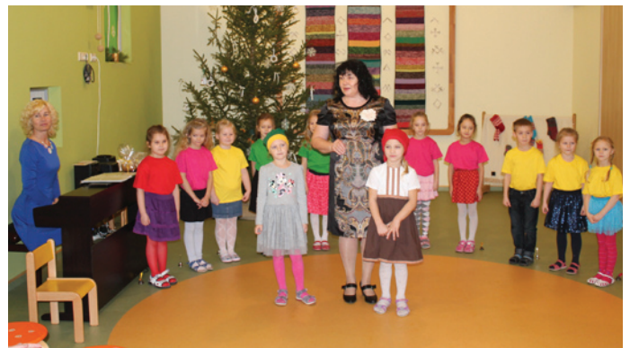
Bērnodārza iemītnieku sagatavotais koncerts var sākties