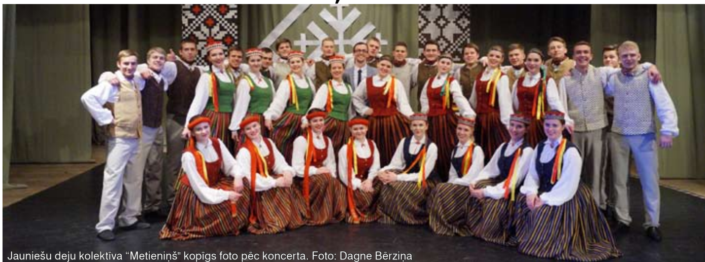
Jauniešu deju kolektīva “Metieniņš” kopīgs foto pēc koncerta.