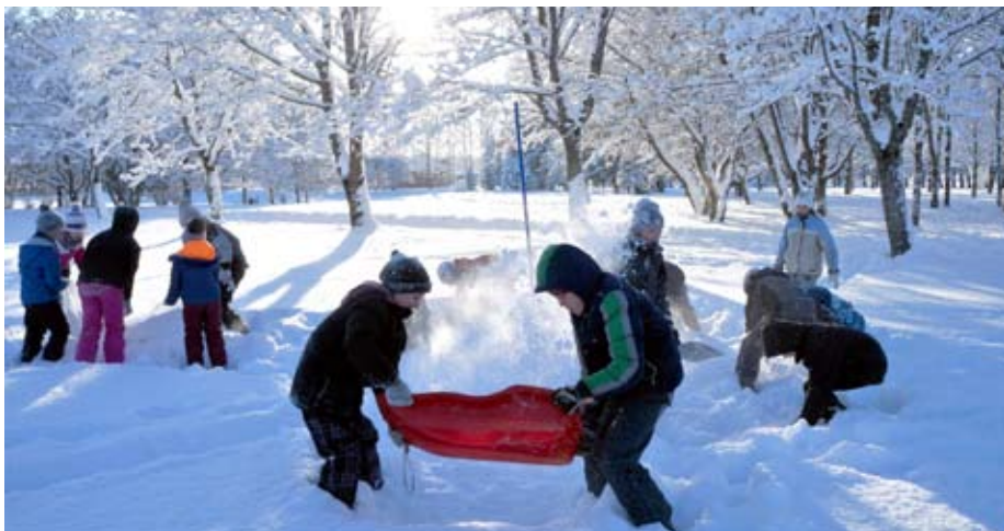
Saulainā 15.janvāra dienā skolēni labprāt rosījās pa sniegu

Pēc divu gadu Sniega dienas bez sniega, beidzot Latviju un arī Raganu klāja bieža sniega kārtā un mēs no sirds varējām izbaudīt visus ziemas priekus. Ļoti jaukā un saulainā 15.janvāra dienā 1.-4. klašu skolēni ar ragaviņām, slēpītēm un citiem braucamajiem sapulcējās pie Krimuldas vidusskolas. Sacensības notika ragaviņu vilkšanā, slēpošanā ar plastmasas slēpītēm, "bobsleja" stafetē, kur visa klase skrēja vienlaicīgi, turoties pie nūjām, un hokeja stafetē. Nobeigumā katrai klasei noteiktā laikā bija jāceļ Pasaules Sniega kalns, kuru augstumu pēc tam izmērīja sporta skolotājas. Tā kā sniegs bija ļoti irdens, tad šo uzdevumu nemaz nebija tik viegli izpildīt.