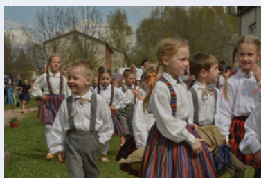
Krimuldas pavasaris 2016

Sezonas atklāšana 6.septembrī plkst. 18:00