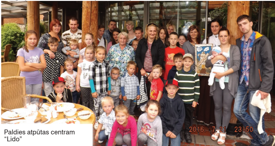
Paldies atpūtas centram "Lido"

Jūlija otrajā pusē biedrības "Sirdsdegsmē+" valde, pateicoties Atpūtas centra "LIDO" sniegtajam atbalstam, sarīkoja ekskursiju uz Rīgu deviņām ģimenēm ar bērniem.