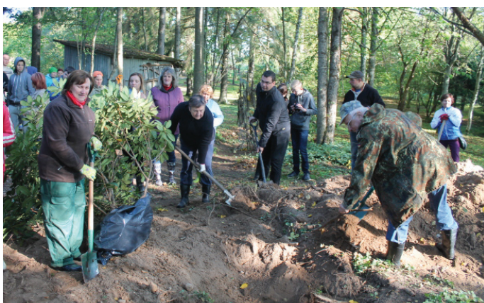
Rododendru audzētavas "Babīte" pārstāvji (priekšplānā) ne tikai sniedza izglītojošu informāciju, bet arī paši piedalījās darbos