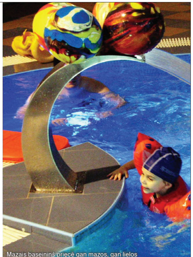
Mazais baseiniņš priecē gan mazos, gan lielos