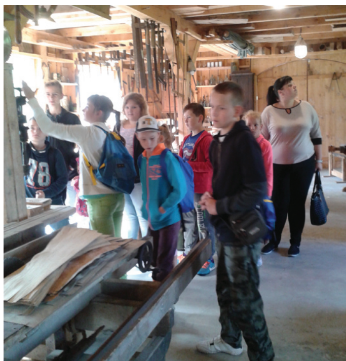
Vienkoču parkā kokamatniecības muzejs ir iekārtots kā darbnīca