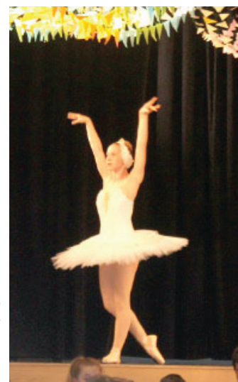
24. oktobrī Krimuldas MMS dzimšanas dienas ģenerālmēģinājumā skatītājus priecēja baleta un tautas deju priekšnesumi

Deju nometnē ļoti cītīgi un neatlaidīgi ar lielu pacietību mācījāmies jaunas dejas un jaunus priekšnesumus, lai 1. oktobrī, Krimuldas Mūzikas un mākslas skolas dzimšanas dienā, pārsteigtu skolas absolventus un ciemiņus.