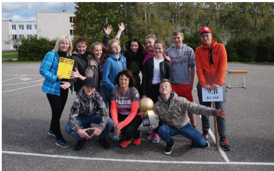
“Olimpiskajā dienā 2016” 1.vietu un galveno balvu ieguva 9. b klase