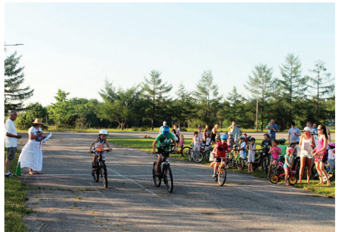
Riteņbraukšanas sacensībās vienmēr ir daudz dalībnieku