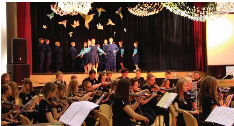
Krimuldas Mūzikas un mākslas skolas triju nodaļu audzēkņi salidojuma koncertā