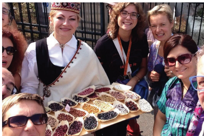
R.Beirote Terra Made kongresā, Itālijā.

Paralēli kongresam Turīnas vecpilsētā un ielās norisinājās arī "Salone del Gusto" jeb Garšas salons - milzu gadatirgus, kur kopā pulcējās tūkstošiem zemnieku un labākos pārtikas ražotāju no visas pasaules, kopā no vairāk kā 160 valstīm. ZS "Zutiņi", pārstāvot Latviju savā stendā lepojās ar tradicionālo alu, spēka rupjmaizi un krāsām latviešu meiteņu tautastērpos un pupiņu laukos. Nozīmīgi, ka latviešiem ir izdevies pārsteigt gan Itāliju, gan citas valstis - jau pirmajā dienā Itālijas nacionālajās ziņās tika rādīts Latvijas stends un stāstīts par "melno maizi", savukārt kāda cita televīzija aicinājusi nogaršot latviešu pavāru gatavoto bubertu.