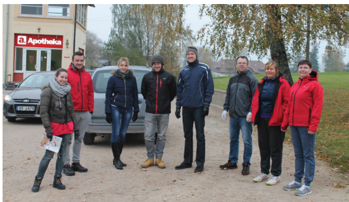
"Glaxo Smith Kline Latvia" pārstāvji gatavi reāliem darbiem palīdzot

14.oktobrī Krimuldas novadā ieradās starptautiskās kompānijas "Glaxo Smith Kline Latvia" pārstāvji uz uzņēmumā pieņemto tradicionālo labdarības akciju, kad vienas dienas laikā kompānijas pārstāvji palīdz cilvēkiem, kam tas ir nepieciešams. Tieši kuriem, "Glaxo Smith Kline Latvia" iepriekš uzzina, sazinoties ar novada sociālo dienestu.