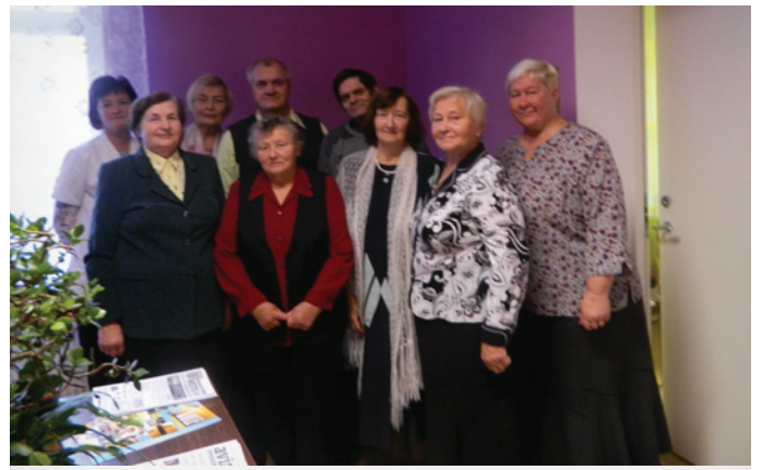
“Kamolīša” pārstāvji un Lēdurgas doktorāta darbinieki

Viesi dzirdēja stāstījumu par pieejamajiem medicīnas pakalpojumiem un jaunāko veselības aprūpē. Sarunas raisījās par to, kas būtu nepieciešams no pensionāriem: regulāri iziet profilaksi, rūpēties par pansionāta “Pēterupe” klientu labsajūtu, motivēt regulāri rūpēties par savu veselību arī pārējos ģimenes locekļus. Viņi arī uzklauzīja labprāt visus padomus un ieteikumus no dr. par veselības veicināšanas pasākumiem un par veselības pakalpojumu pieejamību pie speciālistiem Savukārt, vēlāk medicīnas darbinieki uzklauzīja pensionāru vēlmes un ieteikumus. Visi vienprātīgi nolēma, ka jāturpina aizsāktā sadarbība, kas veicinās pacientu veselības uzlabošanu.