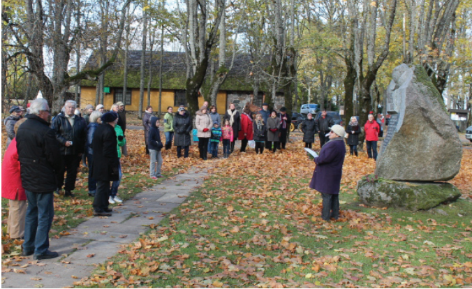
Anšlava Eglīša talanta cienītāji pulcējās pie rakstniekam veltītā pieminekļa.

Bija prieks, ka sapulcējās dažādu vecumu cilvēki un viktorīnā piedalījās pat mazie, komanda „Futbolisti”. Zirdziņš rāmi klidzināja, vizinādams braukt gribētājus. Pa parku ņipri skraidīja ļaužu pulciņi un pāri ar apdrukātām lapām rokās. Degunus un vēderus sildīja cienasti – pavisam cita aina, nekā redzam parastā svētdienā.