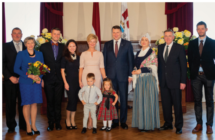
LV prezidents R.Vējonis ar kundzi un Viestura, Sandras Liepiņu (kreisajā pusē) ģimeni: abiem dēliem, vedeklu, mazbērniem Vēl par "Kalndunduru" saimniekiem lasiet 4.lpp.

"Zemnieki ir mūsu valsts sargi. Kamēr vien Latvijas laukos kāds