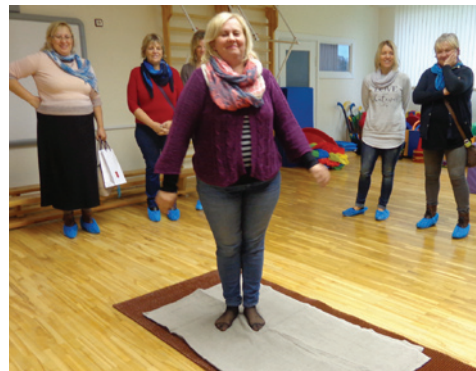
PII "Ezerciems" kolektīvs gūst pieredzi bērnodārzā Kuldīgā.

Šo pirmskolas izglītības iestādi apmeklēt izvēlējāmies tāpēc, ka, tāpat kā mūsu bērnodārzā, tur uzmanība tiek pievērsta veselīgam dzīves veidam un norūdišanas procedūram, daudzveidīgām sporta aktivitātēm ikdienā, valeoloģiskās izglītības ietvaros.