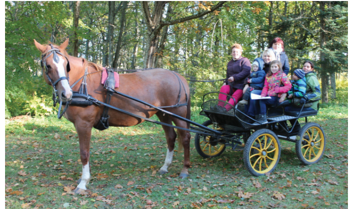
Visiem, bet īpaši bērniem bija prieks doties izbraukumā zirgu dāmas Reprīzes pajūgā.