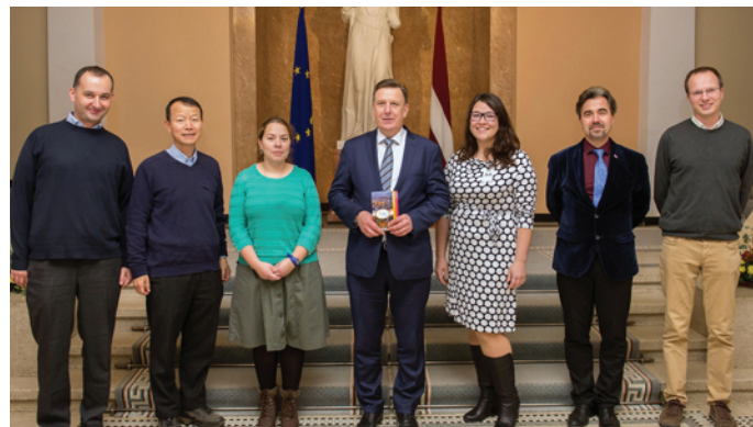
Ministru prezidents M.Kučinskis (centrā) ar Tezē Eiropas jauniešu tikšanās Rīgā organizatoriem

Ministru prezidents Māris Kučinskis 9.decembrī Rīgā tikās ar Tezē Eiropas jauniešu tikšanās Rīgā organizatoriem, lai uzklautu viņus pirms gada nogalē gaidāmās tikšanās Latvijā. Plānots, ka tās ietvaros Rīgā ieradīsies aptuveni 15 tūkstoši jauniešu no 50 pasaules valstīm. Šādas jauniešu tikšanās dažādās valstīs tiek rīkotas teju 40 gadus, un šī būs pirmā reize, kad Eiropas tikšanās tiek rīkota kādā no Baltijas valstīm.