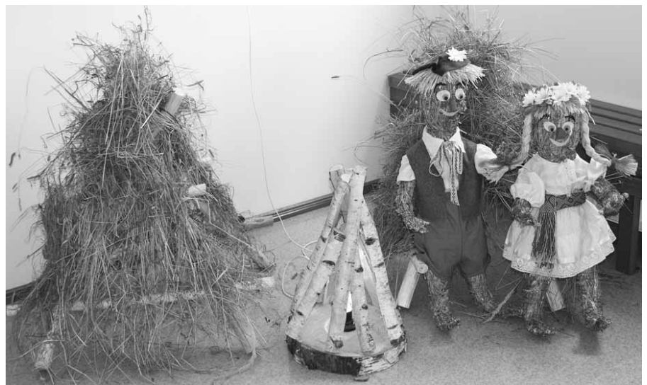
Līgo svētku noskaņa Kokneses speciālajā internātpamatskolā – attīstības centrā.