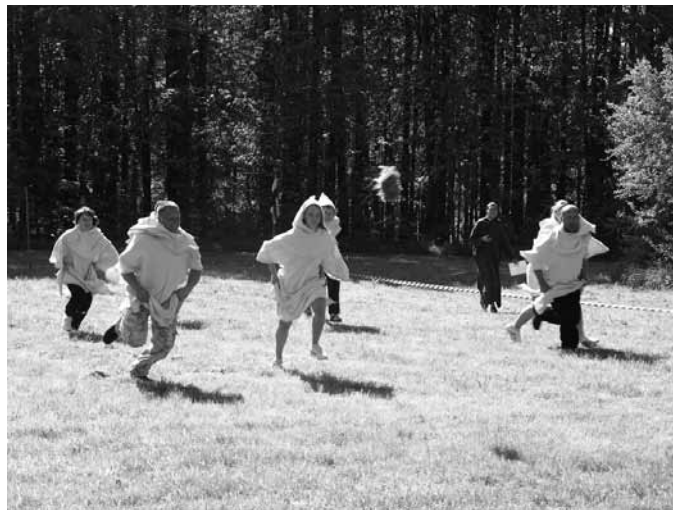
Azarts un cīņas spars viduslaiku sporta spēlēs.

19. maijā visas dienas garumā Koknesē notika „Sama modināšanas svētki”. Jau otro gadu ar lielā Sama modināšanu ir uzsākta tradīcija simboliski atzīmēt tūrisma sezonas atklāšanu Koknesē.