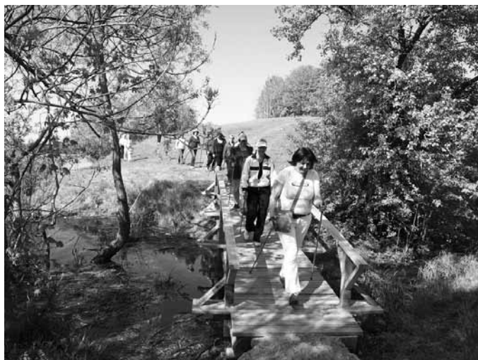
Nūjotāji dodas pārgājienā pa jaunatklāto dabas taku.