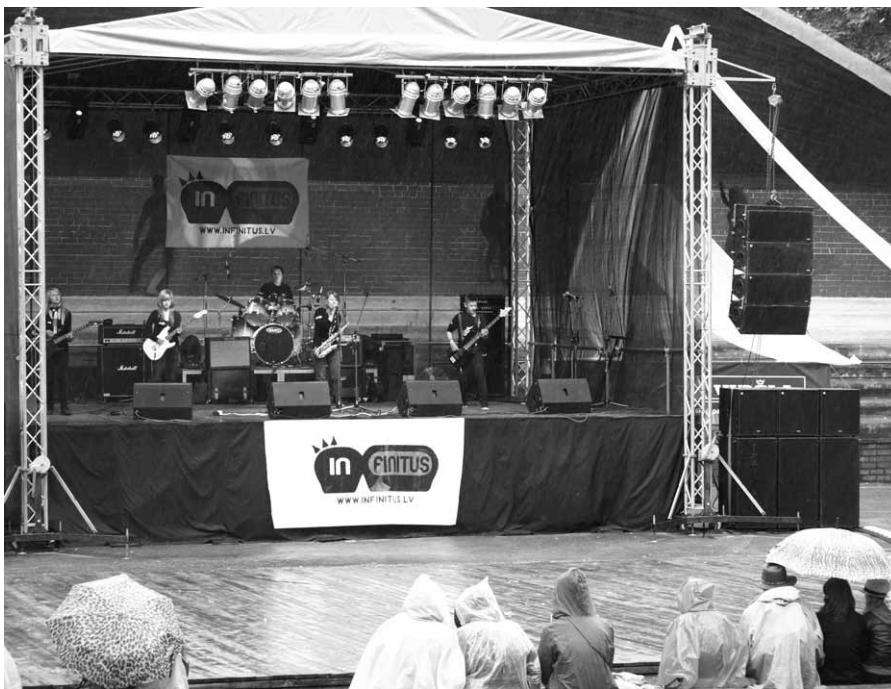
Jauno grupu konkursā trešo vietu ieguva koknesieši – grupa „Nepilns litrs”.

Šī gada 2. jūnijā Koknesē notikušais mūzikas un mākslas festivāls INFINITUS 2012 veiksmīgi noslēdzies, un gan apmeklētāji, gan paši organizatori guvuši daudz pozitīvu emociju.