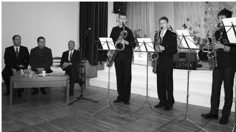
Muzikāls veltījums skolēniem skan no Kokneses Mūzikas skolas pūšaminstrumentu klases audzēkņu kvarteta.

16. maijā uz svinīgu pasākumu tika aicināti 146 I. Gaiša Kokneses vidusskolas skolēni, kuri 2011./2012. mācību gadā veiksmīgi startējuši dažādās mācību olimpiādēs un konkursos, sporta sacensībās, kā arī guvuši panākumus, darbojoties zinātniski pētnieciskajā jomā. Daļa skolēnu veiksmīgi piedalījušies vairākās mācību olimpiādēs un sporta sacensībās, iegūstot atzinības un godalgotas vietas.