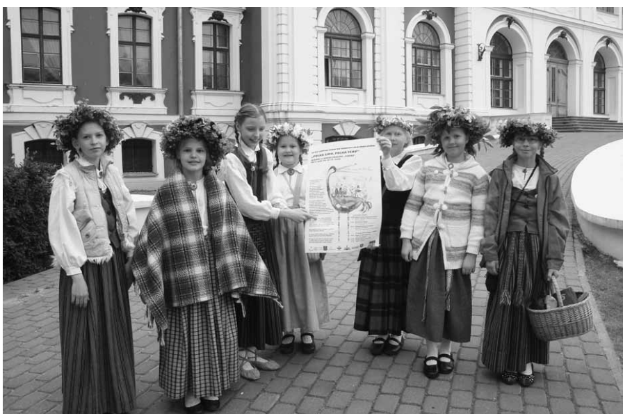
„Tīne” Bērnu un jauniešu folkloras programmas nacionālajā sarīkojumā Jelgavā.

I. Gaiša Kokneses vidusskolas folkloras kopa „Tīne” 26. un 27. maijā piedalījās Bērnu un jauniešu folkloras programmas nacionālajā sarīkojumā Jelgavā un tās apkārtnē - XXVI-II PULKĀ EIMU, PULKĀ TEKU 2012, uz kuru devās folkloras kopas no visiem Latvijas novadiem. Šī gada sarīkojuma tēma – putni.