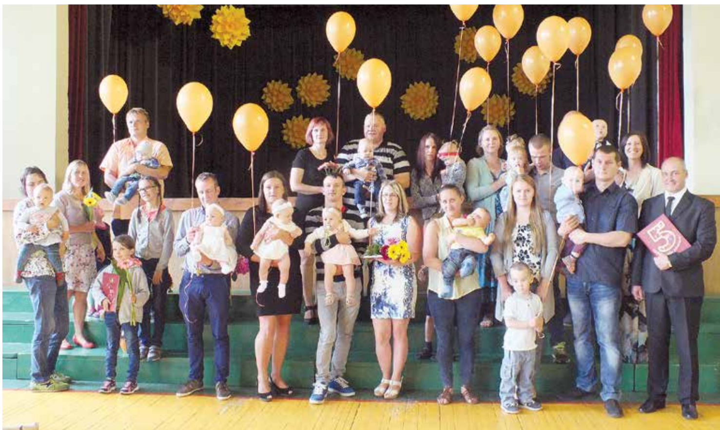
Kā katru gadu pagasta svētkos tiek sveikti jaundzimušie bērniņi. No 2016. gada maija līdz 2017. gada martam Limbažu pagastā piedzimuši 8 zēni un 7 meitenes, tai skaitā dvīņītes.