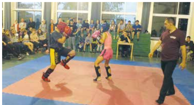
Pēc koncerta skolas zāle pārvērtās par kīkboksa ringu un sākās kīkboksa sacensības, kurās piedalījās sportisti no visas Latvijas, bet uzvarētāju godalgām bija piesaistīti sponsori-Limbažu novada uzņēmēji. Pasākums tapis pateicoties: SIA "Limbažu ceļi", SIA "Super Bebris", SIA "VIT BŪVE" un Limbažu pagasta pārvaldei.