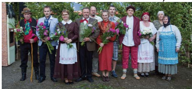
Leimaņu Tautas nama amatierleātris

2017. gada 22. jūnijā Leimaņos, Latvju zīmju parka estrādē notika Jāņu ielīgošana ar dziesmām, dejām un skroderu būšanām. Uzstājās Leimaņu Tautas nama VPKD "Deldze", vīru vokālais ansamblis un pirmo reizi arī jaunais pagasta amatierleātris. Tika spēlēti fragmenti no R. Blaumaņa lugas "Skroderdienas Silmačos". Pēc tam sekoja balle ar grupu "Kontrakts".