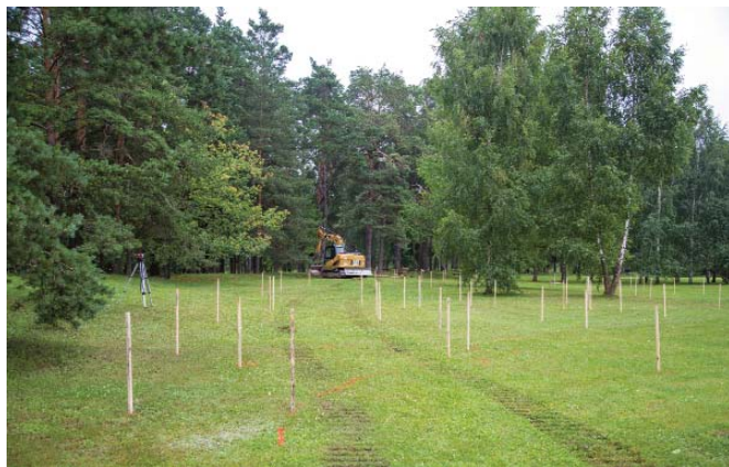
27. jūlijā sākās Akuratera takas Brodos izveides būvdarbi.

Atbalsta Zemkopības ministrija un Lauku atbalsta dienests