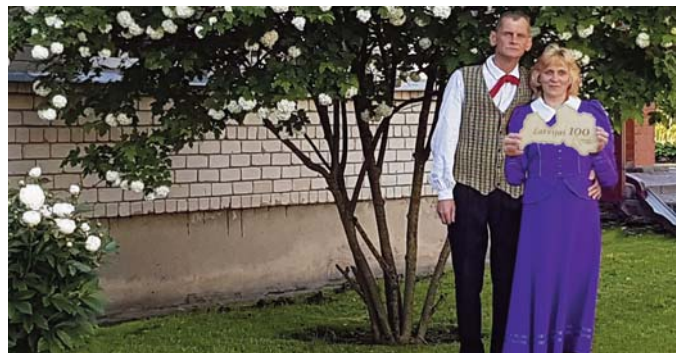
Lāciņu ģimene pie Mežgales kultūras nama Leimaņu pagastā.