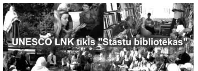
UNESCO LNK tīkls “Stāstu bibliotēkas”

UNESCO LNK tīklā “Stāstu bibliotēkas” mērķis ir veicināt neformālo izglītību mantojuma jomā caur stāstniecību, sadarbojoties ar piesaistītiem mantojuma, tradicio-