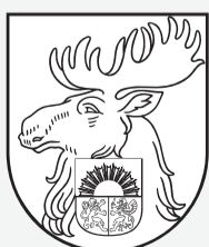
Ģerbonis kontūrzīmējumā bez fona