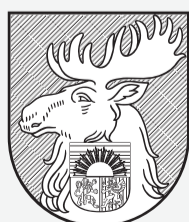
Ģerbonis kontūrzīmējumā ar fonu

Krāsu kodi: alnis – RGB 208 132 73; CMYK 10 50 80 0; Pantone 7407C; purpura krāsa – RGB 156 33 61; CMYK 0 100 60 30; Pantone 7427.