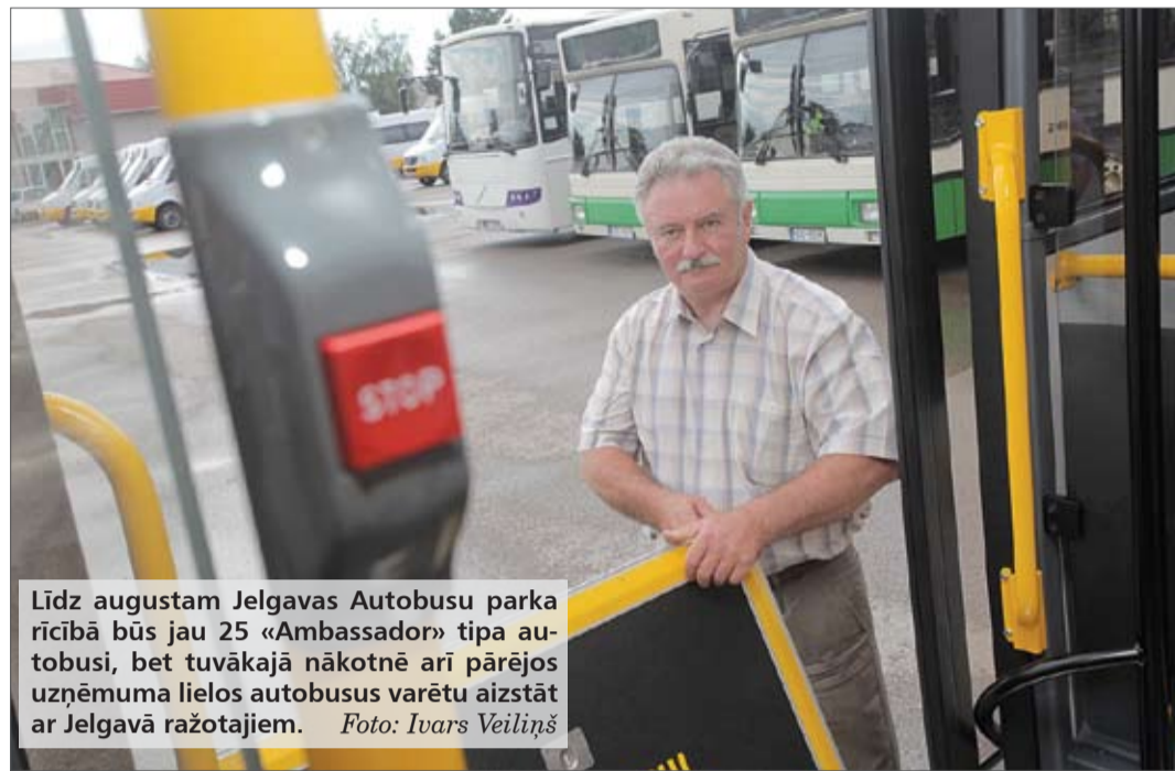
Līdz augustam Jelgavas Autobusu parka rīcībā būs jau 25 «Ambassador» tipa autobusi, bet tuvākajā nākotnē arī pārējos uzņēmuma lielos autobusus varētu aizstāt ar Jelgavā ražotajiem.