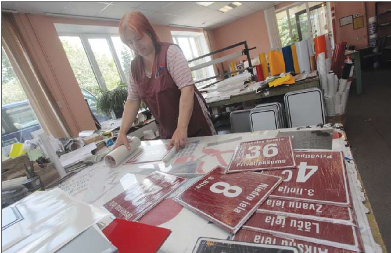
Jelgavas pilsētas ēku numerācijas norādes plāksni SIA «Signum» var izgatavot vidēji divu darba dienu laikā. Norādes, kas saistoša privātmāju īpašniekiem, izgatavošana izmaksā 6,05 latus.

«Jelgavas Vēstneša» redakcijā vērsās kāda jelgavniece, rosīnāt aktualizēt jautājumu par mājas numura zīmēm. Viņai pašai grūtības sagādājis mūsu pilsētā atrast uzņēmumu, kurš varētu izgatavot saistošajiem noteikumiem atbilstošu norādi. Taču, kad tas izdarīts, izrādījies, ka numura zīmes izgatavošana nav dārga un aizņem vien pāris dienas. «Manuprāt, informācijas par to tiešām ir maz. Ja arī citi zinātu, ka tas ir tik viegli un lēti izdarāms, tad vecās zīmes noteikti nomainītu agrāk par 2014. gadu,» tā viņa.