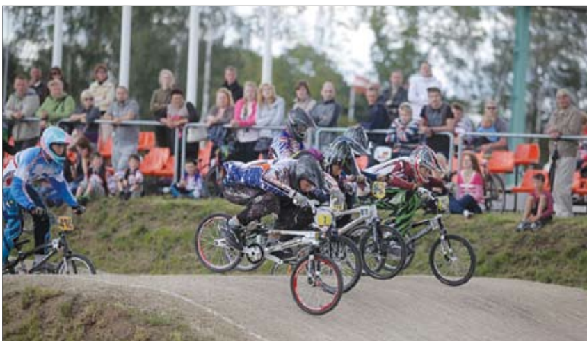
Aizvadītajā nedēļas nogalē Jelgavas BMX trasē notika Latvijas Riteņbraukšanas federācijas kausa un ZOC kausa izcīņa. Sacensības pulcēja ap 170 dalībnieku no Latvijas, Lietuvas, Igaunijas un Baltkrievijas.

Jāpiebilst, ka šosezon Jelgavā notiks vēl vienas BMX sacensības – 8. septembrī pie mums būs Grand Prix Latvia noslēguma posms jeb lielais fināls. «Par to, ka Jelgavā var notikt un notiek dažādas sacensības, paldies jāsaka Jelgavas domei, Sporta servisa centram un ZOC,» piebilst A. Balbeks.