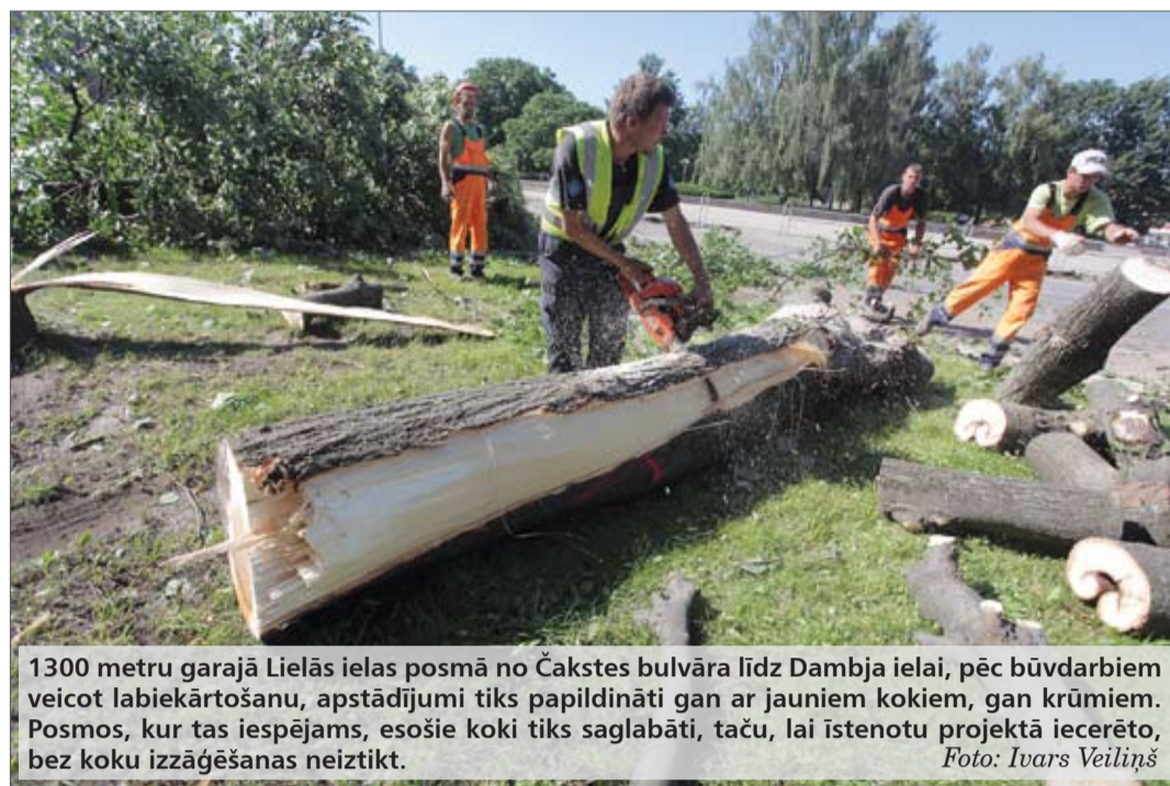
1300 metru garajā Lielās ielas posmā no Čakstes bulvāra līdz Dambja ielai, pēc būvdarbiem veicot labiekārtošanu, apstādījumi tiks papildināti gan ar jauniem kokiem, gan krūmiem. Posmos, kur tas iespējams, esošie koki tiks saglabāti, taču, lai īstenotu projektā iecerēto, bez koku izzāģēšanas neiztikt.