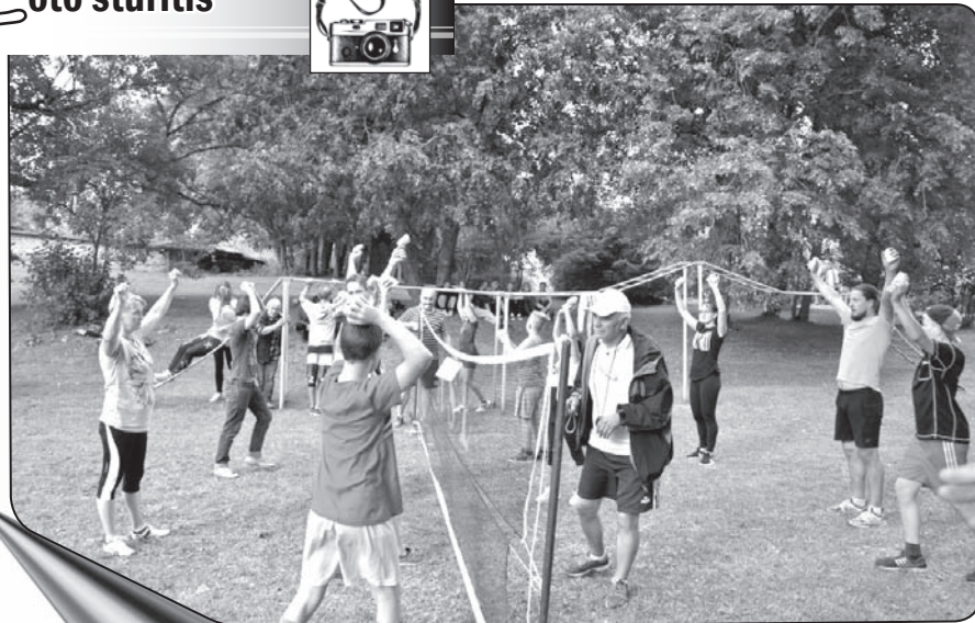
Vijciema sporta svētkos aizraujošas cīņas izvērtās švammbolā - šādu sporta veidu komandas izspēlēja pirmo reizi!