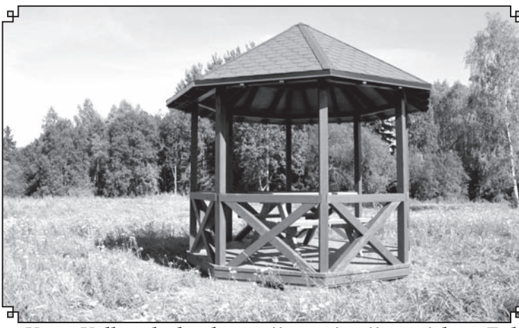
Vecās Valkas dzelzceļa stacijas teritorijā projekta «Zaļā dzelzceļa līnija» ietvaros tika ierīkota atpūtas vieta - uzbūvēta skaista lapene!

Valkas novada domes kopējais projektā piešķirtais budžets ir 34 225,00 EUR, no kuriem 29 091,25 EUR (85% no izmaksām aktivitātēm Valkas novadā) līdzfinansē Eiropas Savienība. Projekts tiek īstenots no 2017. gada 1.marta līdz 2019.gada 30.aprīlim. Projekta vadošais partneris ir Vidzemes Tūrisma asociācija, tā kopējais budžets ir 1 174 938 EUR, no kuriem 85% līdzfinansē Eiropas Savienība. ☼