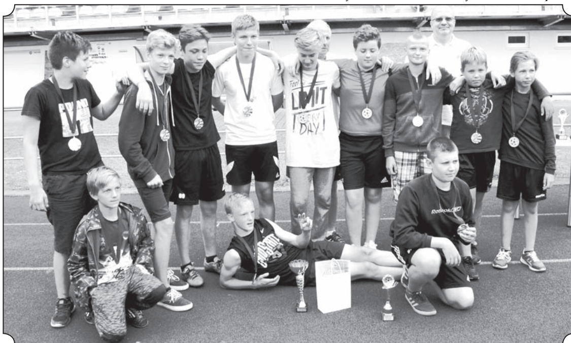
Valkas komanda Starptautiskajā turnīrā «Valkas – Valgas kauss 2017» U - 14 grupā izcīnīja 2.vietu.