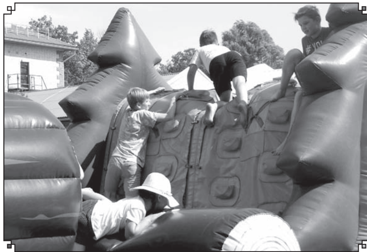
Pat lielais karstums un tveice, reizēm jūtoties kā uz pannas, neaptur bērnus baudīt svētku prieku.

Kārķu pagasta pārvaldes vadītājs Pēteris Pētersons