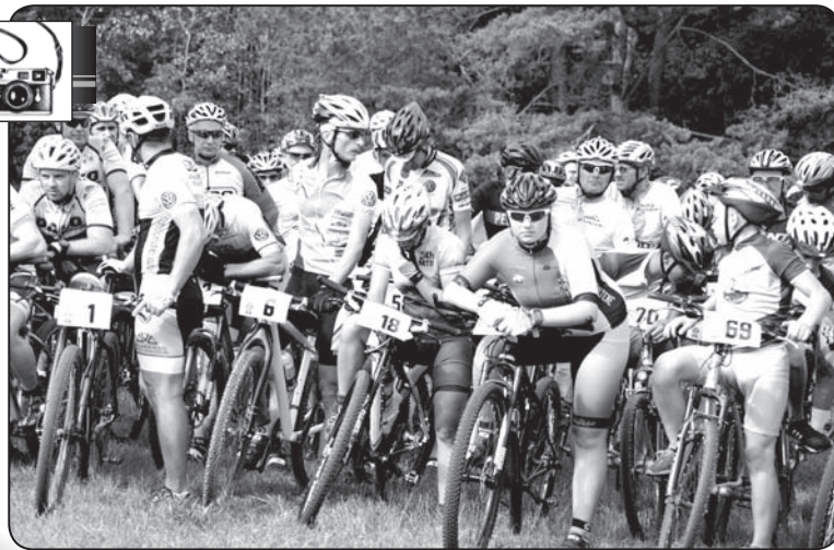
Valkas četrčīņas 2017 - 2. posms MTB riteņbraukšanā.