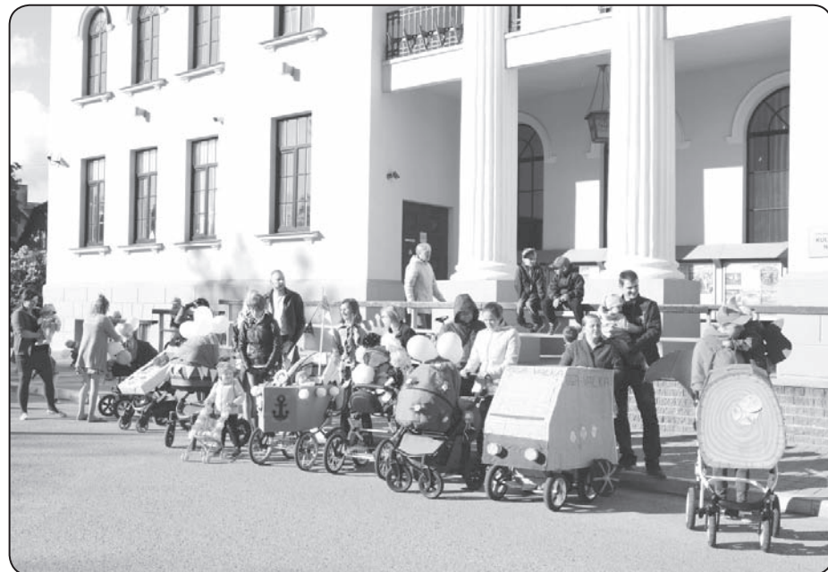
Starptautiskajai bērnu aizsardzības dienai veltīts pasākums «Sveika, mīļā vasariņa!».

Sazināties ar mums: info@vietagimenei.lv. ☞