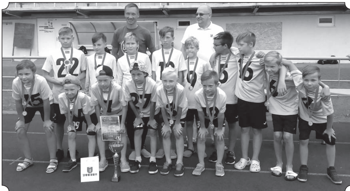
Par Starptautiskā futbola turnīra bērniem un jauniešiem «Valkas – Valgas kauss 2017» uzvarētājiem U - 11 grupā kļuva FC «Gauja» no Valmieras, kas aizvadīja turnīru, nezaudējot nevienu spēli.

Tālāk - piektie FC «Warrior» no Igaunijas, sestie - vietējā Valkas komanda, bet septītie palika «Ibilin Hapoel» otrā komanda. Jāpiezīmē, ka Ibilinas komanda sadalījās divās komandās, lai puīši iegūtu lielāku spēļu praksi. ☼