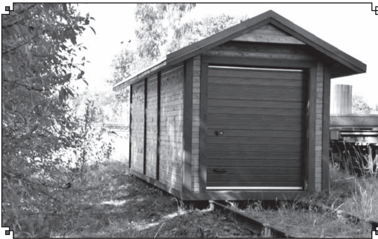
Tāpat projekta ietvaros tika realizēta ideja par slēdzamās riteņu novietnes jeb garāžas uzbūve, lai pēc sliežu riteņu iegādes tos varētu glabāt drošā vietā!