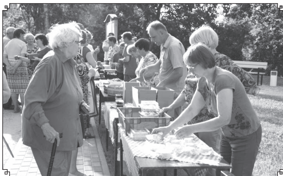
Vietējo mājražotāju produkcija Kārķos ir atpazīstama un pieprasīta. Pirk un pārdotprieku turpmāk vēl vairāk veicinās rekonstruētais tirgus laukums.