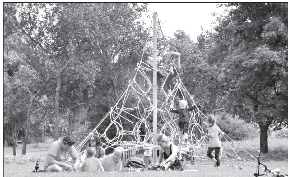
Vijciema sporta svētkos bija sapulcējušies vairāk nekā 230 dalībnieki un to skaits dienas gaitā tikai pieauga