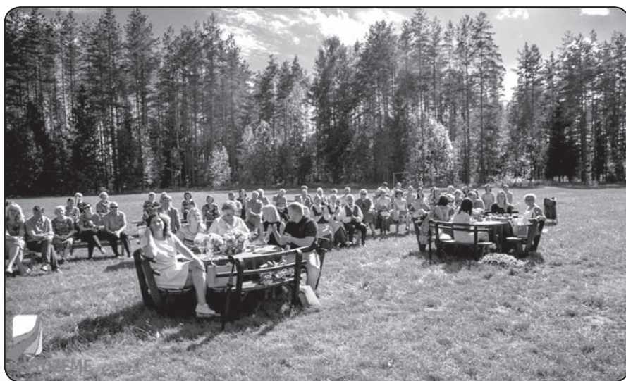
Vidzemnieku dārza svētki 2017.