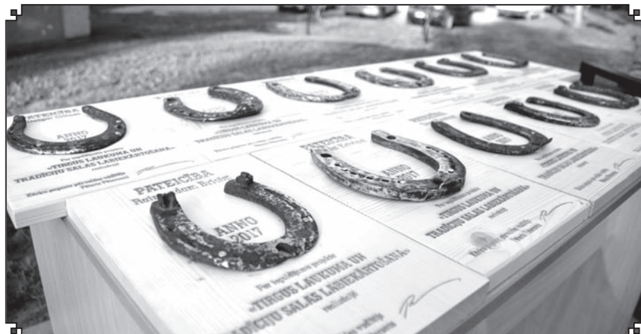
Rekonstruējot Tirgus laukumu un izbūvējot Tradīciju salu, atrasti 18 zirgu pakavi. Pagasta pārvaldes vadītājs Pēteris Pētersons atklāšanas ceremonijā tos dāvina cilvēkiem, kuri visvairāk ieguldījuši pūļu un radošo izdomu projekta realizācijā.