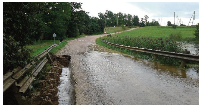
Ceļš P72 Kaldabruņā