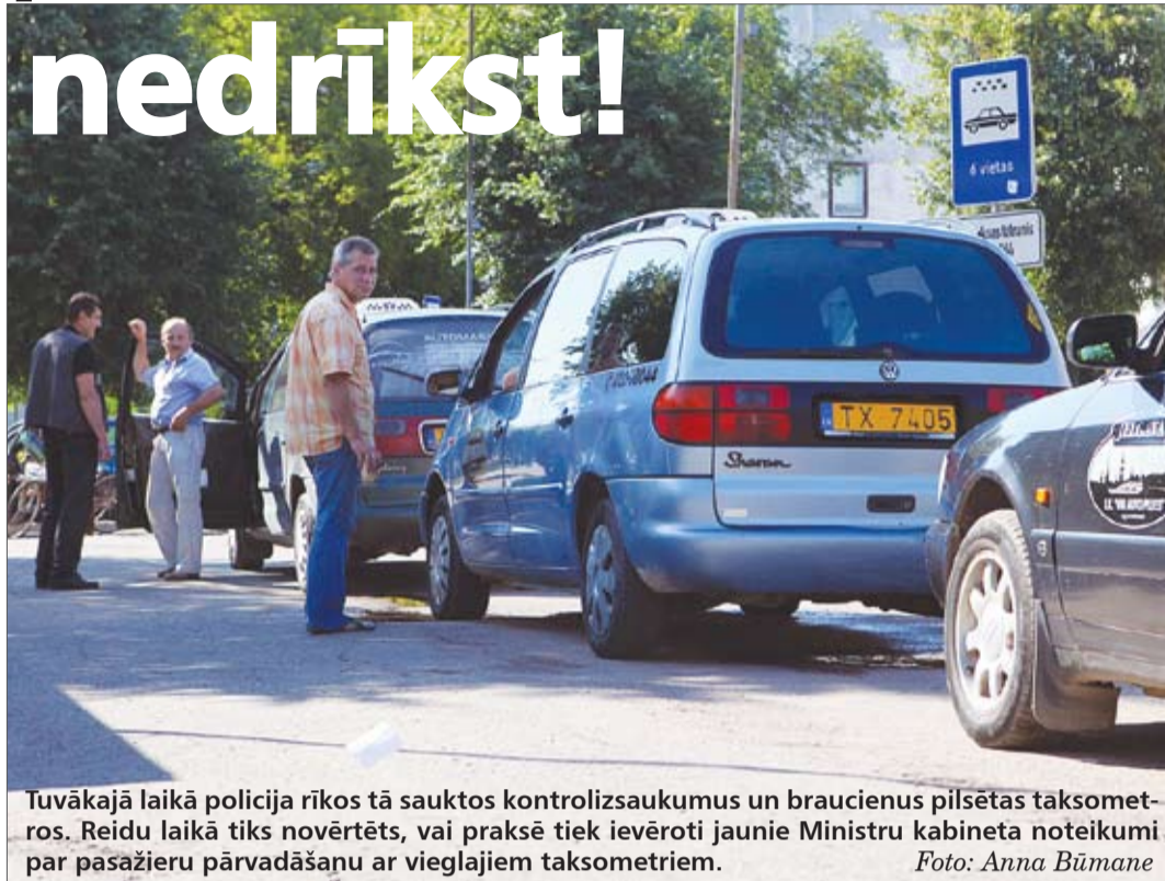
Tuvākajā laikā policija rīkos tā sauktos kontrolizsaukumus un braucienus pilsētas taksometros. Reidu laikā tiks novērtēti, vai praksē tiek ievēroti jaunie Ministru kabineta noteikumi par pasažieru pārvadāšanu ar vieglajiem taksometriem.