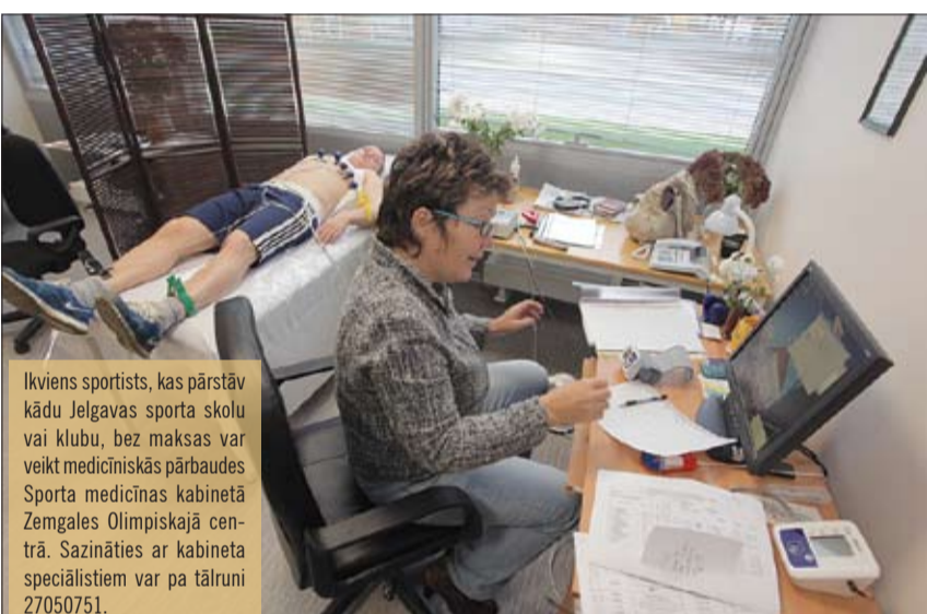
Ikviens sportists, kas pārstāv kādu Jelgavas sporta skolu vai klubu, bez maksas var veikt medicīniskās pārbaudes Sporta medicīnas kabinetā Zemgales Olimpiskajā centrā. Sazināties ar kabineta speciālistiem var pa tālruni 27050751.

Sporta medicīnas kabinets darbojas kopš marta – tā ir Sporta servisa centra iniciatīva, un kabinetu finansē pašvaldība. Tagad Jelgavā veselības pārbaudes bez maksas var saņemt visi sportisti no ikviena pilsētas sporta kluba. «Šo pārbaudu būtība ir pēc iespējas agrāk pamanīt pataloģiju un sniegt rekomendācijas, lai sportisti nesabojātu savu veselību, jeb, moderni sakot, skrīnings. Bet tas jau ir tikai pirmais posms, jo uzskatu, ka galveno atlasī veic pats sports – ikviens jau pats jūt, kad