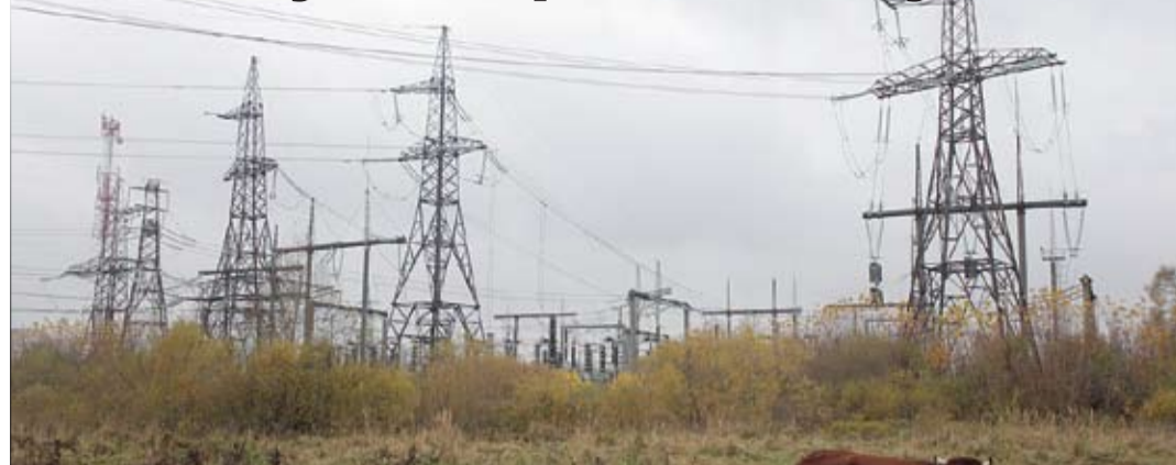
Viskaļu apakšstacija, kas nodrošina elektrības piegādi lielākajā daļā Jelgavas un tās apkārtnē, ir viena no vecākajām Latvijas apakšstacijām – tā ir celta 1939. gadā. Lai uzlabotu tās darbu, «Latvenergo» pēc pāris gadiem plāno sākt apakšstacijas rekonstrukciju.