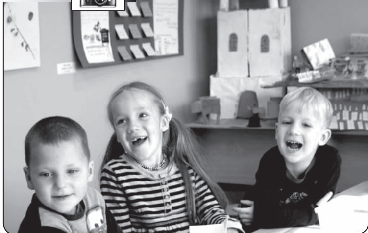
Bērnu rīts Valkas novada Centrālajā bibliotēkā.