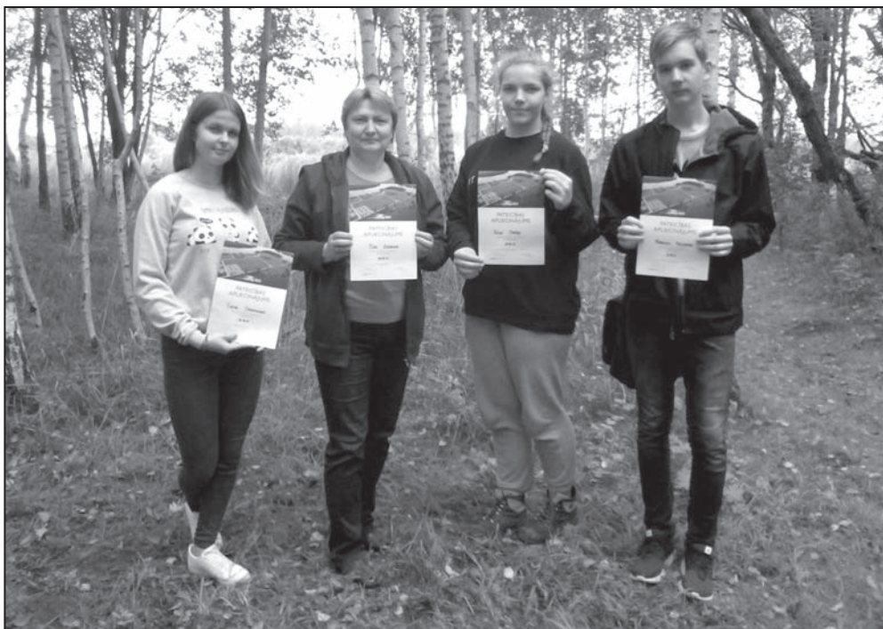
Talkas dalībnieki no Valkas

hercoga starptautisko apbalvojumu īpaši ir sasnieguši visus pašu izvirzītos apbalvošanas pasākumā saņemtie, kas, mērķus, ievērojot programmas Award prasības,