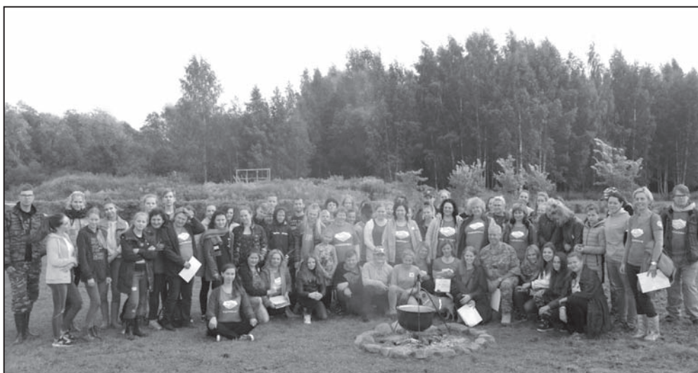
9.Award rudens talkas dalībnieku kopbilde

Latvijā Edinburgas hercoga starptautisko jauniešu pašaudzināšanas programmu Award īsteno Valsts izglītības satura centra licencētās skolas, jauniešu centri, novadu domes un biedrības. Ikvienam jauniešim, kurš vēlas iegūt The Duke of Edinburgh's International Award (Edinburgas hercoga starptautisko apbalvojumu), ir jāizveido individuāla izaugsmes programma, kuru veido četras jomas – brīvprātīgais darbs, fiziskā sagatavotība, prasmes un piedzīvojumu ceļojums -, bet zelta līmeni papildus četrām pamatjomām ir jāizstrādā un jārealizē projekts. Bronzas, sudraba vai zelta Edinburgas