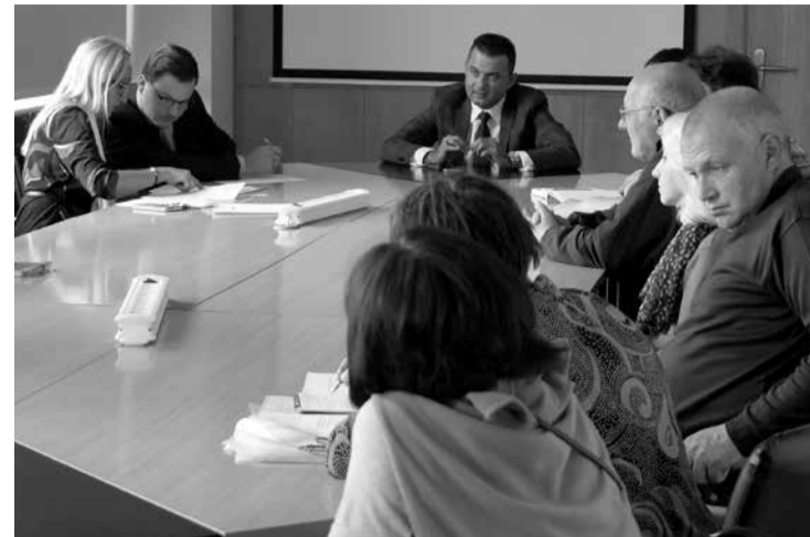
Starp Saeimas deputātu un klātesošajiem biedrību pārstāvjiem izvērtās konstruktīva diskusija.

Mūsu biedrību aktīvistiem arī turpmāk vajadzētu cīnīties par