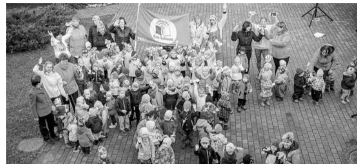
Lai iestāde varētu pretendēt uz Ekoskolas nosaukumu, darbā bija jāiesaistās visam bērnodārza kolektīvam – gan skolotājiem, tehniskajiem darbiniekiem, vecākiem un bērniem.