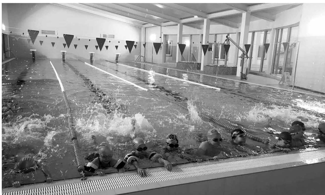
Salaspils 1. vidusskolas 3. klases skolēni apgūst peldēšanas pamatus.

Ar katru gadu Salaspilī arvien vairāk attīstās sporta infrastruktūra, un šeit ir iespējams nodarboties ar teju visiem populārākajiem sporta veidiem. Nu tiem ir pievienojies arī peldēšana, jo no oktobra Salaspils peldbaseins ir vēris durvis ikvienam. Jau tad, kad baseins bija būvniecības stadijā, pašvaldība regulāri saņēma iedzīvotāju jautājumus - kad tad varēs peldēt? Nu ir pienācis brīdis, kad salaspiliešu sen lolotais sapnis ir kļuvis par īstenību.