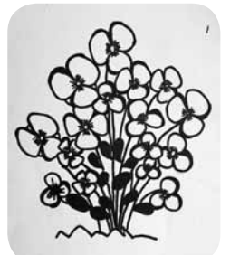
Elza Agnese Koklačova Ērgļu MMS 3. kurss

Skolotāja: Dieviņš zina uz 10, Anna uz 9, skolotāja uz 8.