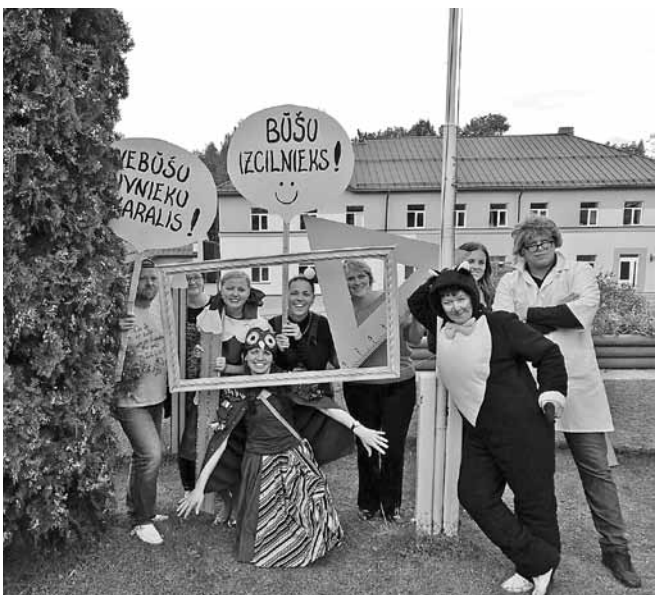
Radošā "Zinību dienas" darba grupa.

1. septembrī pēc svinīgā brīža vidusskolā un mākslas un mūzikas skolā visi Ērgļu bērni bija aicināti uz Zinību dienas svinībām pie saietā nama. Tikāmies, lai kopā uzzinātu, izmēģinātu, svērtu, klausītos, atrastu, radoši izpaustos un smietos.