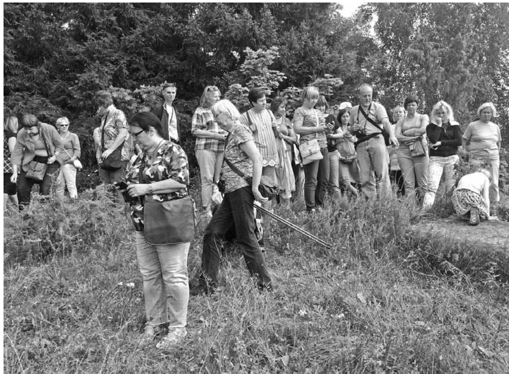
Konferences dalībnieki praktiskajās nodarbībās Bākūža kalnā.

Pasākums noslēdzās ar skatu uz Ērgļiem no Kaļvu kalna skatu