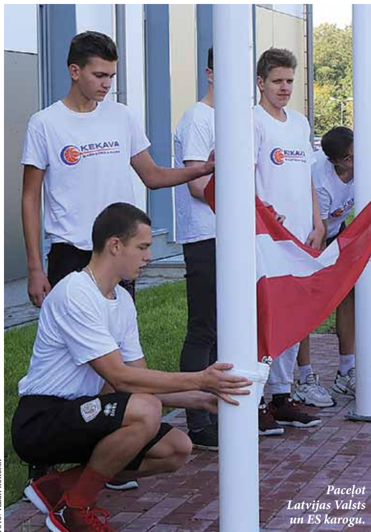
Paceļot Latvijas Valsts un ES karogu.