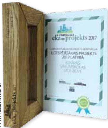
Balva „Ilgspējīgākā ēka un projekts 2017” – Ķekavas sākumskola.

Ķekavas sākumskolas būvniecība kopumā noritējusi trīs kārtās. Divās pirmajās tika izbūvētas mācību klases, aktu zāle un ēdināšanas bloks. Kopējais skolas būvniecības finansējums – 20,4 milj. eiro, 10,5 milj. eiro no tiem izlietoti trešajai kārtai.