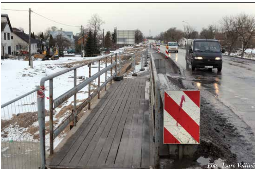
Lietuvas šosejas posma no Rūpniecības līdz Miera ielai rekonstrukcija jāpabeidz līdz novembrim. Darbu veicējs «A.C.B.» izmanto labvēlīgos laikapstākļus un turpina objektā darbus: izbūvē kanalizāciju paralēlajā ceļā un drīzumā sāks izbūvēt aizsargsienu ar zeju uz autobusu pieturu.

Lietuvas šosejas rekonstrukcija no Rūpniecības ielas līdz Miera ielai tiek veikta, īstenojot Eiropas Reģionālās attīstības fonda līdzfinansētu projektu «Lietuvas šosejas rekonstrukcija posmā no Miera ielas līdz Rūpniecības ielai». Projekta kopējās izmaksas ir nepilni četri miljoni latu. Projektu plānots pabeigt līdz šā gada novembrim. Darbus veic akciju sabiedrība «A.C.B.».