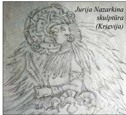
Jurija Nazarkina skulptūra (Krievija)