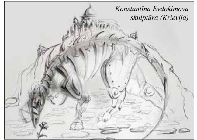
Konstantīna Evdokimova skulptūra (Krievija)