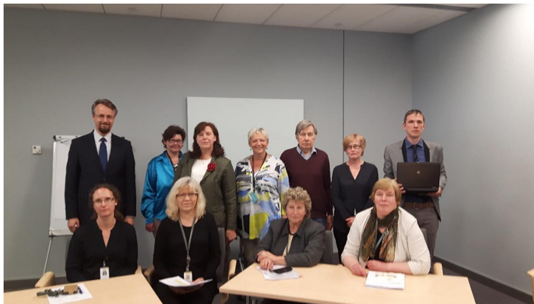
ID TAK locekļi pēc sēdes