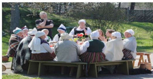
Zvejniekciema „Dzirnavas” pie baltā kļāta galdā iekārta dziesmas un valdīja priecīgi noskaņojums.

Gatavojoties Latvijas valsts simtgades svinībām, Latvijas tauta