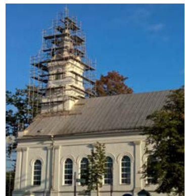
2017. gada rudens. Sākts baznīcas torņa remonts

Līdz šim lielākās neskaidrības un pretrunas ir bijušas ar tagadējās baznīcas celšanas gadu. Dažādos drukātos avotos, interneta publikācijās un pat Latvijas Romas katoļu baz-