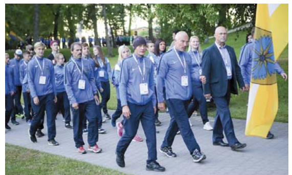
Novada komanda olimpiādes atklāšanas pasākumā Cēsīs.

Noslēgusies Latvijas Jaunatnes olimpiāde, kas no 7. līdz 9. jūlijam notika Cēsīs un citviet Latvijā. Smiltene novada komandas sportisti Jaunatnes olimpiādē izcīnīja trīs zelta un trīs bronzas medaļas, pašvaldību vērtējumā (pēc izcīnītajām medaļām) ieņēm piecpadsmito vietu.