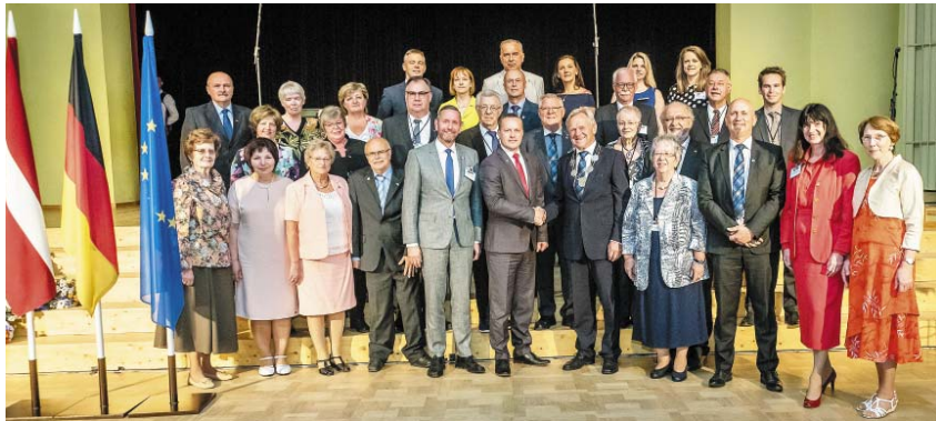
Partnera līguma parakstīšana.

Lai stiprinātu savstarpējo sadarbību, 22. jūnijā tika parakstīts līgums par partnerību starp Smiltene novada domi un Villihus pilsētas pašvaldību Vācijā.