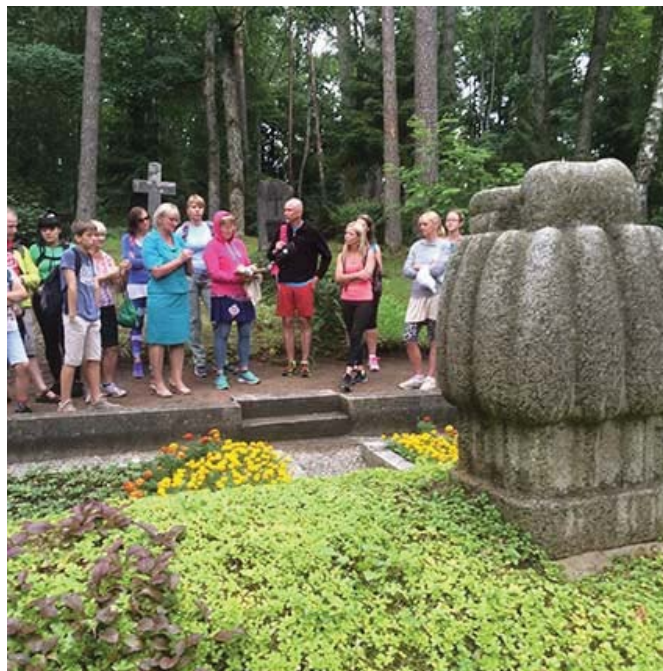
Ķišku kapos pie Jāņa Jaunsudrabiņa kapavietas

Tālāk ceļš vijās uz Neretu. Lietus, kurš negaidīti sākās, tika veiksmīgi pārļauts Neretas ev. luteriskajā baznīcā, klausoties