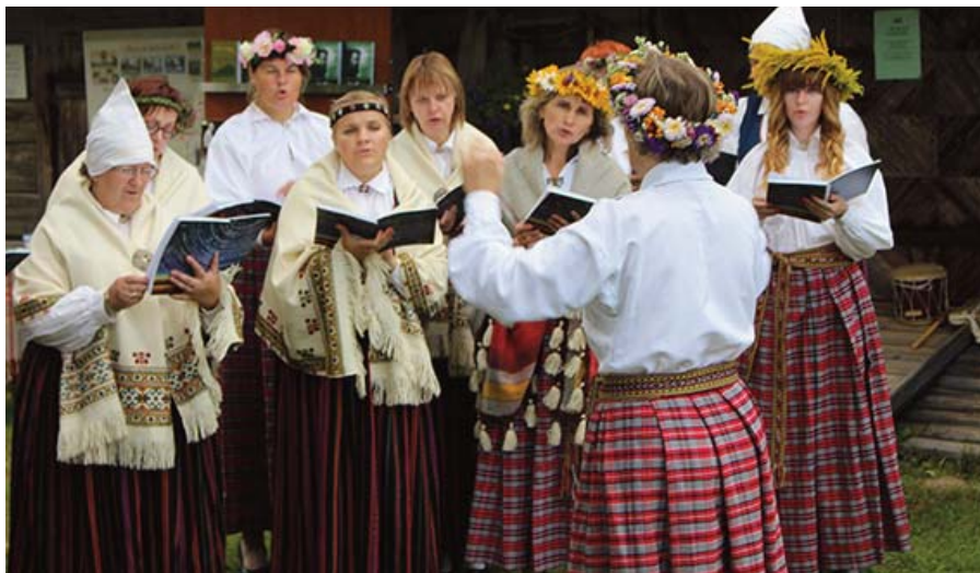
Jāņa Jaunsudrabiņa 140.jubilejas pasākumu kuplināja kori gan no Kokneses, gan Rīgas un Pļaviņām