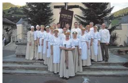
VPDK „Sēļi” dejotāji un vadītāja

Būsi ļoti gaidīts viesis deju kolektīva „Sēļi” 30 gadu jubilejas koncertā , kas notiks šī gada 4. novembrī plkst. 18.00 Neretas kultūras namā! Pēc koncerta kārtīga balle grupas „Starpbrīdis” pavadībā! Par dalību informējiet privāti! Neaizmirsti padot ziņu savam bijušajam deju partnerim!