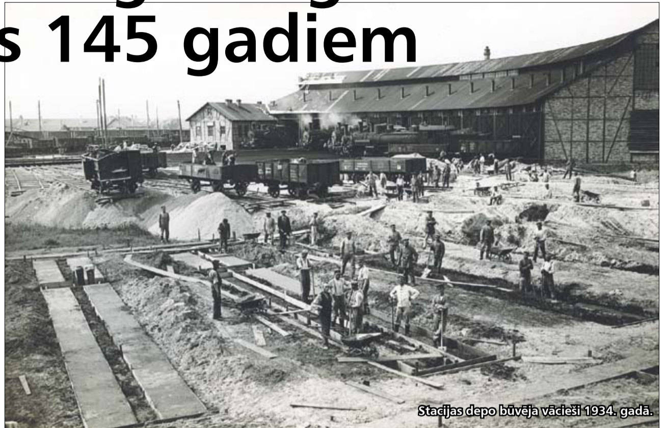
Stacijas dego būvēja vācieši 1934. gadā.

Jelgavas stacija visā tās pastāvēšanas vēsturē ir bijis stratēģiski ļoti svarīgs trans-