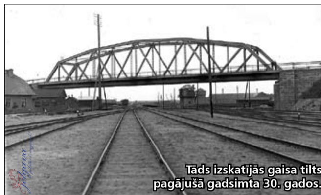
Tāds izskatījās gaisa tilts pagājušā gadsimta 30. gados.