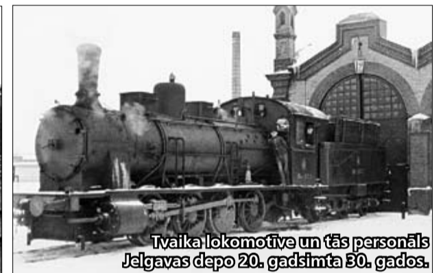
Tvaika lokomotīve un tās personāls Jelgavas dego 20. gadsimta 30. gados.

porta punkts un savu nozīmi nav zaudējis arī šobrīd. «Latvijas dzelzceļa» pārstāvis M.Ozols norāda, ka pērn gandrīz puse visu Latvijas dzelzceļa kravu tika vestas caur Jelgavu: uz Ventspili ap 40 procenti, uz Liepāju – apmēram 7 procenti. 2012. gadā kopējais pa dzelzceļu pārvadāto kravu apjoms bijis 60,6 miljoni tonnu. Savukārt, runājot par pasažieru pārvadājumiem, pērn pasažieru apgrozījums Jelgavas stacijā bija 1,52 miljoni. Tas nozīmē, ka vidēji dienā caur staciju «izgājis» 4151 cilvēks.