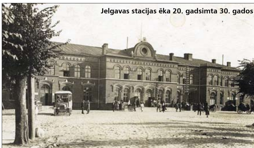
Jelgavas stacijas ēka 20. gadsimta 30. gados

• «Smaga vilciena katastrofa šodien īsi pēc pl. 10 r. notikusi starp Jelgavas un Cukurfabrikas staciju. No Jelgavas uz Rīgu pl. 10 r. atgājis vilciens Nr.12, kas braucis no Liepājas līdz Jelgavai bez pieturas. No Liepājas vilciens izbraucis pl. 6 rītā un Jelgavā ieradies noteiktā laikā. Tāpatā ceļā, aiz Jelgavas stacijas vēl nenoskaidrotu iemeslu dēļ no sliedēm pēkšņi izleca bagāžas un viens 3. klases pasažieru vagonis, kurā braukuši vairāki pasažieri. Katastrofas brīdī pasažieri notiekti no saviem sēdekļiem un daži arī ievainoti. Katastrofā nogalinātas divas personas un divas smagi ievainotas. Domājams, ka nelaimē notikusi nepareizi noliktas vai bojātas pārmijas dēļ.» («Jaunākās Ziņas», 1937)