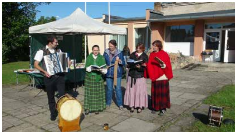
Ar jautrām tautasdziesmām tirgotājus un pircējus priecēja Subates kultūras nama vokālais ansamblis „Sonāte”

Neliela, vienas dienas saulaina spraudziņa starp lietaino rudens laiku apspīdēja tradicionālo Rudens gadatirgu Subatē 16. septembrī. Tirgus norisēs tika ievīti Dzejas dienu motīvi. Dzejnieka Alberta Kronenberga, kam šogad atzīmējam 130. jubileju, spilgtiem raksturiem un humoru piesātinātā poēma „Sprunguļmuižas gadatirgus” harmoniski sasaucās ar gadatirgu izdarībām.