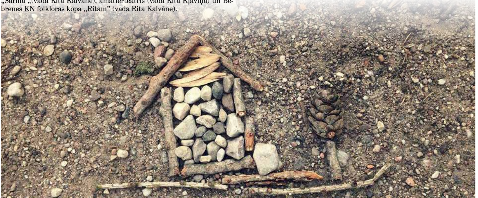
Izstādes, lekcijas, nodarbības, jauns uzadīts cimdu pāris vai jaunapgūta kūkas recepte... Arī rudens var kļūt par laiku, kad gūt ko jaunu, kad neļauties pelēkajām dienām, bet drosmīgi tās krāsot ar jaunām emocijām!

Raksts tapis sadarbībā ar pagastu pārvaldēm, kultūras iestādēm, BJC