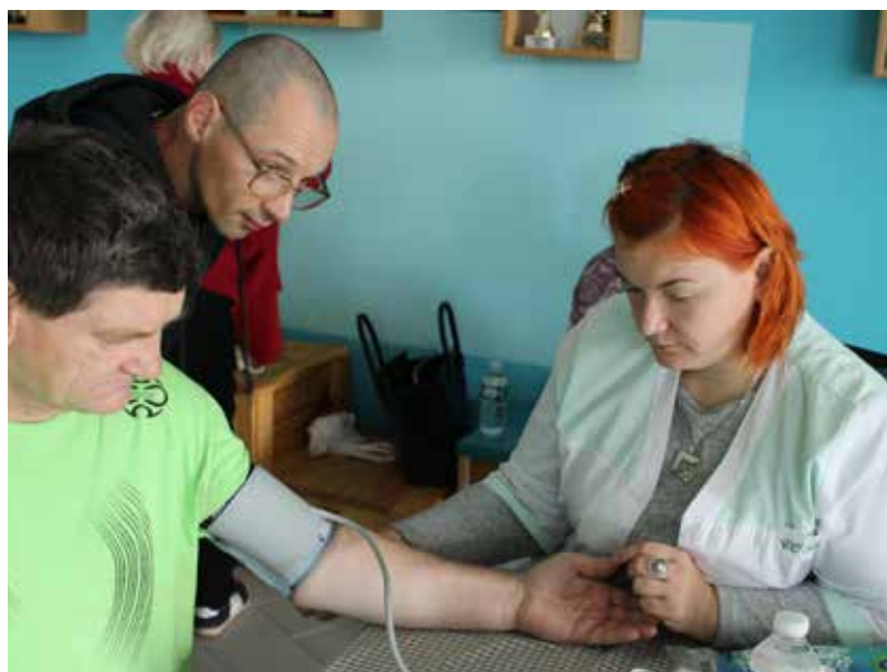
Pasākumos darbojās Veselības stūrītis - asinsspiediena, cukura līmeņa asinīs mērīšana, svēšanās, ķermeņa masas indeksa noteikšana - padomi pareizam un pilnvērtīgam uzturam