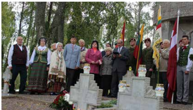
Atceres pasākumu “Varoņu vēstures ceļš” Latvija – Lietuva – 100” organizēja 1919.–1920. g. Brīvprātīgā Lietuvas Rokišķu rajona Kara kapu biedrība, Daugavpils lietuviešu biedrība „Rasa”, Rokišķu novada muzejs, atbalstīja – Lietuvas Republikas Krasta aizsardzības ministrija, Ilūkstes novada pašvaldība