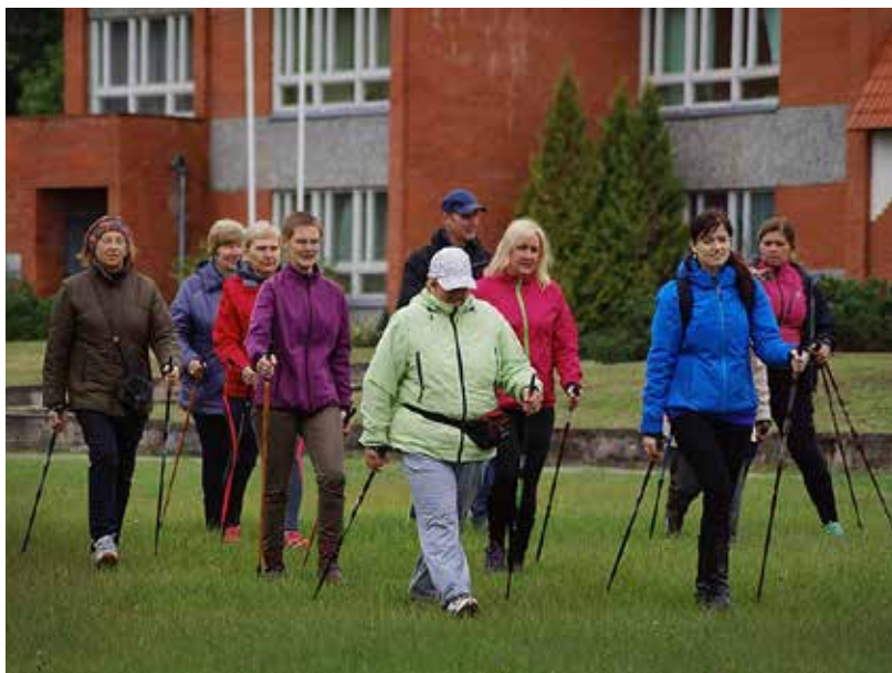
30. septembra rītā Bebreņē sākās „Nūjošanas festivāls ar foto orientēšanās sacensībām”