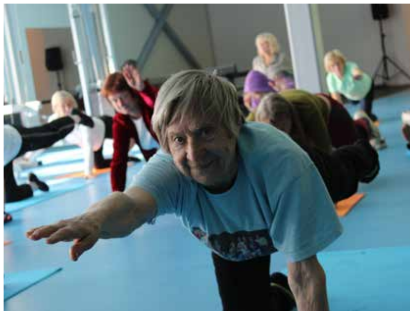
Sporta spēles personām ar invaliditāti un senioriem tika iesāktas ar iesildīšanos, ko vadīja fizioterapeite