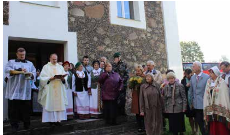
Ar svinīgu dievkalpojumu Sventes Vissvētākās Trīsvienības Romas katoļu baznīcā tika pieminēti no 1918. līdz 1920.gadam bojā gājušie Lietuvas karavīri