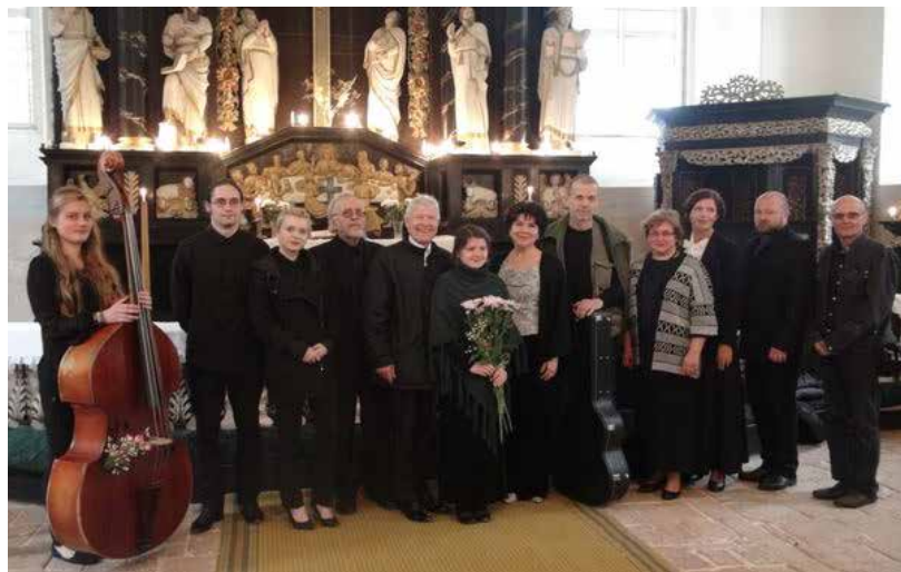
Uzstājās mākslinieki no Daugavpils, Subates un Jēkabpils