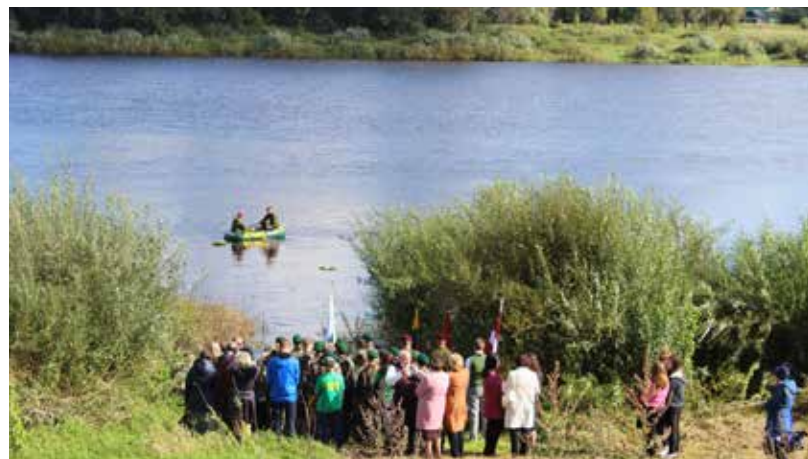
Šajā simboliskajā vietā - Arones ciemā pie Daugavas - Daugavā tika palaidīti ozola vainagus, simbolizējot ne vien ceļu uz brīvību un pieminot kritušos, bet arī simbolizējot abu tautu draudzību, sajūtot stiprās kopīgās saites.