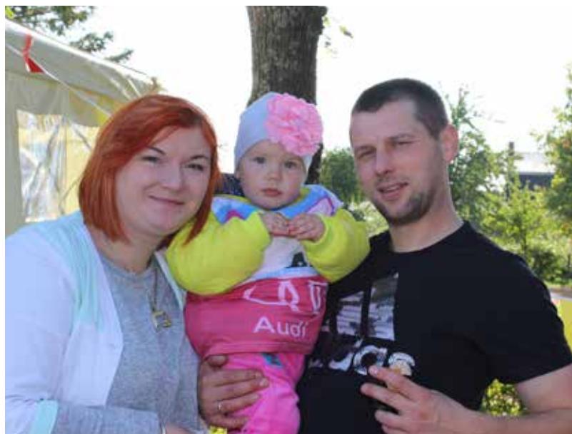
23.septembrī, paralēli notiekošajam Ilūkstes ielu skrējienam, aizvadījām "Ģimenes sporta un veselības dienu"