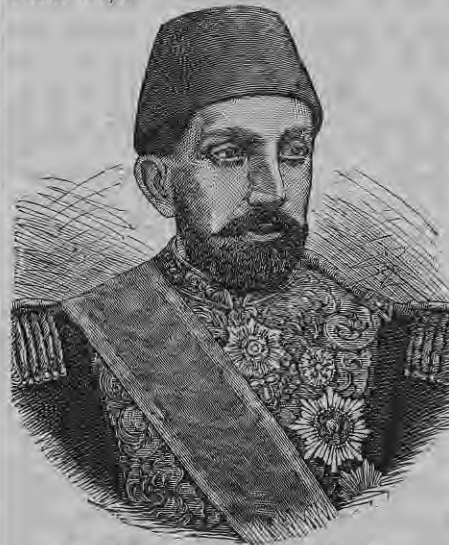
Sultans Abdul Hamids II.,

Kreewu waldischāna ir apstallejūstī Wahšemē Krupa šakīst kahdus 700 leelošs gabalus, kam Aprika mehnešt wajag gata-weem buht.