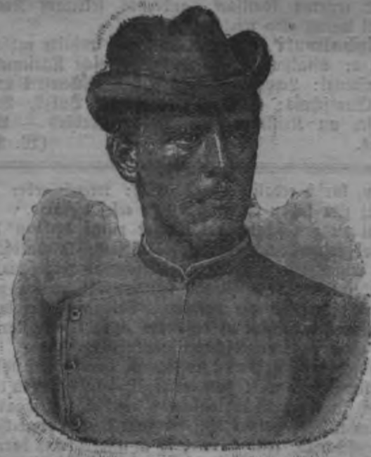
Dr. Fritjof Nansen.