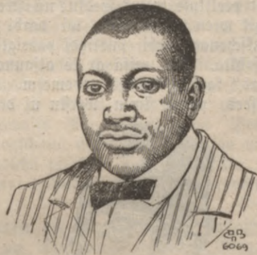
Negeris Johnsons, leelatais pasaules boksetajs.

Londonā, 28. (15.) jūlijā. Reitera agentura sino, ka amerikani nodomajuschi usnemtēs protektoratu par Afrikas negeru republiku Liberiju. Us Liberiju aissuhitīs jau amerikānu waldbibas representants. Schis amerikānu solis fajet Londonas politikajās aprindās sensajiju.