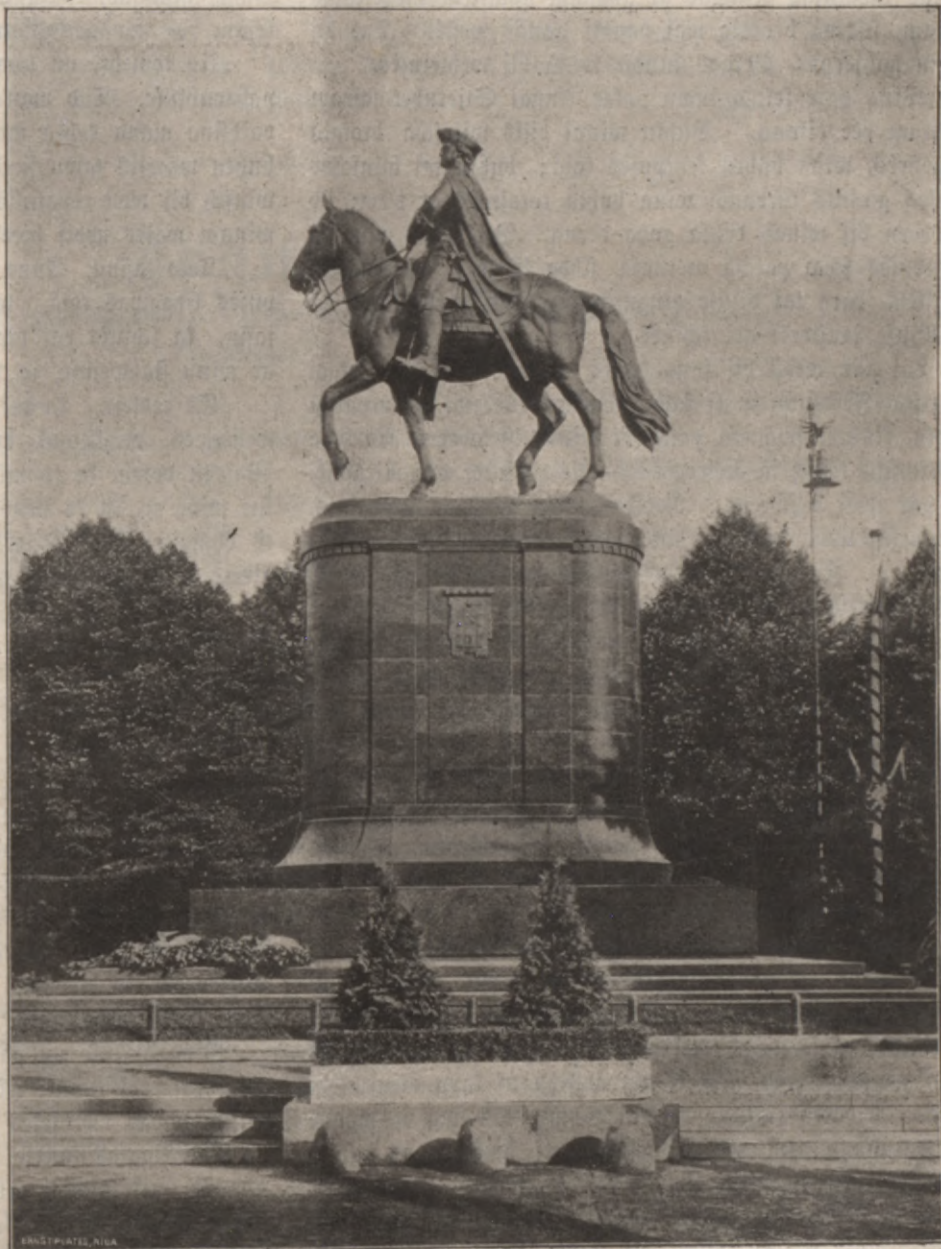
Petera Deelā peeminelka atklahſchana Rīgā, 4. juliā.

Tās bij koſchs lihka gahjeens — pa leepu aleju uſkapeem. Appuſchko'ajam ſahrtam pa preeſchu gahja behrni, kaiſdami pukes. Te nebij neweena ſehru tehrpa, neweena melna krēpa plihwura, jo nelaika mahte bij wehlejuſēs, lai preezigi miruſchā dehla ſahrtu nepawada ſehrigi kaudis,