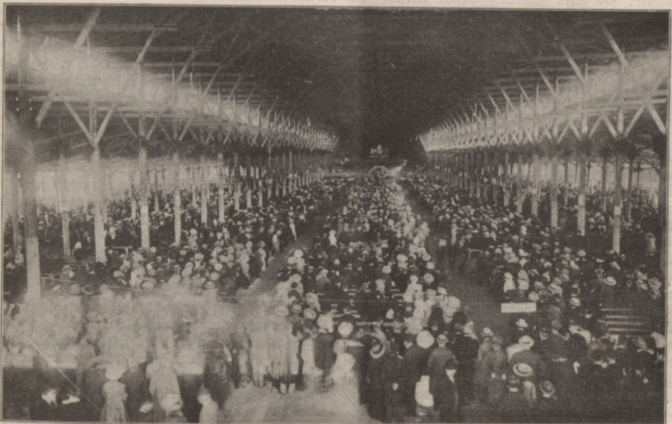
Dšedafchanas ſwehttu ehlas iſſtats eefſchpuſē garigā konzertā.