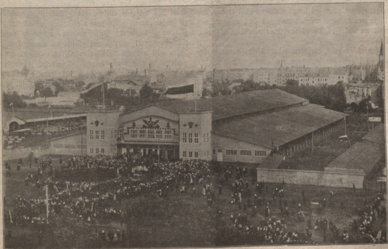
Dseedaschanas fwehtku ehta atlahšchanas deenā.

postizija „Lihgo fwehtki“. Staišis fimfonists tehlojums. Pehz šcheem orkestra gabaleem nu nahja trihs wihru kora dseefmas, kuraš orkestra un ehrgelu pawadibā atstahja dšitu, paleekamu ēspaidu. Kremšera wez-niederlandeeschu uswaras luhgšchana un pateiziba „Uš Lewi, af muhschigais, pazelam rolas, Tu teesā, kā katris to pelnijs buhs!“ atstahja wārenu ēspaidu. Ēapat ari ta pašcha Kremšera „Kungs