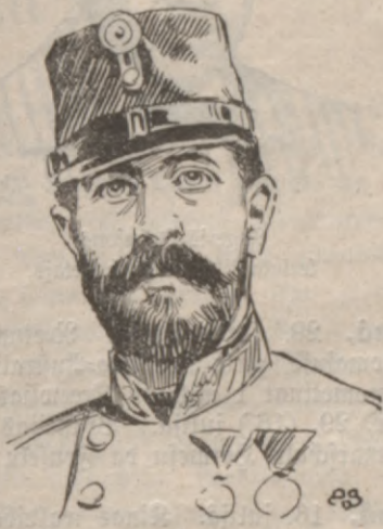
Johanns Orths. (Erzherzogs Johanns Salvators 1890. g.)