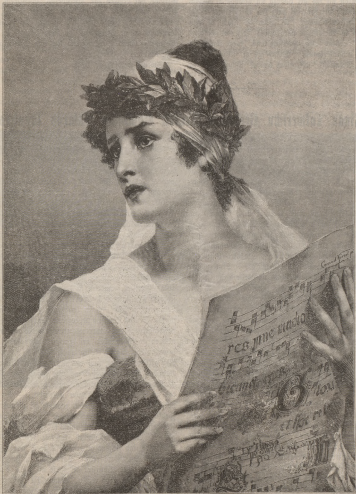
Dseesmu gars — K. Kihjela.