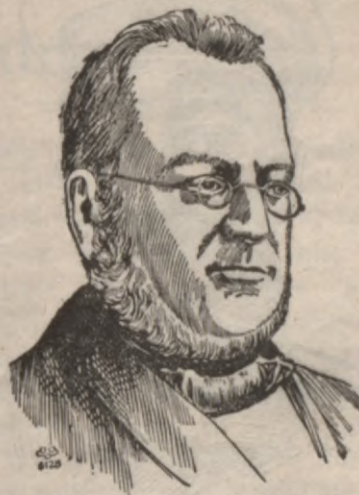
Italijas leelatais walſiwiſſr grafs Kamils di Kawurs (Camillo di Cavour).

baldis ta karotajs bijuſchi iſhtenee tagadejâs Italijas raditaji. Stary Spanijas waldbibu un pahweſtu eefahkufes iſlihdſinafſchanâs. Abas pufes peekahpjâs. Pahweſts ſahjis wairal uſflaukt kardinala Rampolla balſi, kurfch eſot Spanijai draudſigs un eeteizot pahweſtam peekahptees. Spaneeſchu ministru preeſchneeks tad ari no ſawas pufes paſtaidrojis, ta wiſſch neefot netahds prinzipiels pahweſta pretineeks un eſot ar meeru iſlihg. — Bijuſchais frantſchu ministru preeſchneeks Klemansô Buenos Aireſâ tura weſelu rindu preeſchlaſjumumu par „demokratiju“. Sawâ preeſch-laſjumâ „Demokratija un karſch“, Klemansô uſſtahjas pret atbruoſchanos un apſweiz tos waldbneekus, kurei negrib no-darbotees ar ſcho jautajumu. Wajaga iſleetot wiſus lih-dſekfus, lai iſwairtos no kara, bet neprahtiba buhtu at-brunoſchanâs tagad, kur wiſſ brunoſjas ta uf fauſſemes ta ari juhrâ un gaſâ. „Mehs nedomajam uf eekarojumeem un neweenam nedarifim netahda kauna, bet muſſu zeena uſleek mums par peenahkumu buht gataweem uf walſis apſardſibu.“ — Anglijâ pa tam Dewanportâ nupat eelaisſis uhdeni wiſleelakais kreifers paſaulê. Wiſſch no-fauktis „Lion“ (Lauwa); ir 700 pehdu gaſch un ta maſchinas attihſta 70,000 ſirgu ſpehtu. Kreifera ahtrums