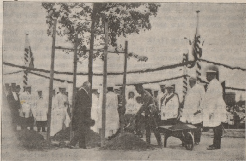
Dsola stahdischana Riga Petera parkā 5. julijs.

"Ja tee ir mani grehti, kas modinajusch Tawas dusmas, tad sodi mani weenu. Ja pee Lewis wehl miht schelastiba, al schelastibas Deews, tad fuhti leetu! . . ."