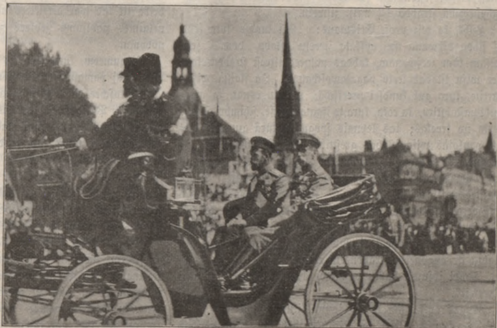
Riģas jubilejas šlati. Wina Majestate Keišars brauz pa Riģu.

širšniga. Un laimiga ir ta tauta, kurā wehl naw šubis naiwais, radošchais genijs. Kad wišchš usfuhs un šewi šakause augštako kulturu, tad nahš břišdis, tad atraišas tautas gars un tautas šapni, kas wehl tumšchi un tikko nojaušchami, isteizas břišwās un neaišmirštamās peršonibās. Antinā parahdas tautas radošchais gars; wišchš pilnigi latwišks rakšurs. Muhsu usmaniba, protams, pee winā nefaištitos, ja wišchš buhtu brammanigi uspuhtigs, ja tas šchwadšinatu šobenu un leelitu břišwibu. Dšejneeks šawu waroni wada pa nomaliti. Antinšchš dara warona darbus un usupurejas, bet wišchš nefšt pee krukštim un neleelas. Klusš tā ehna wišchš šlihds, bet kad darbu dara, tad wiššš peeder leelam ufdewumam. Štipri realais šons peepalihsds jo relješi isželtees idealam waronim: Antinšchš tā wehl škladrats un baltaks teek. Šamehr abi gudree břišchi, padobamees šwehriškeem instinkeem, dalās mantu, weens otru