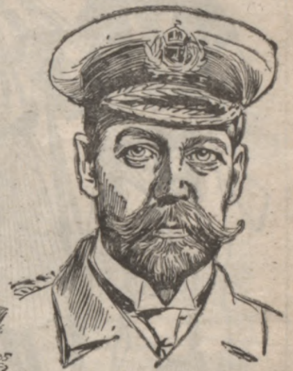
Angļu karalis Georgs V.

mihlestibas wina nekad nebija mihlejuse. Nekad wina nebija palahwuses aishaut sewi deļā waj padewuses glahsteem Apputejuse un bes stihgu karajās winas mahtes gitare behninos pee seenās. Nekad wina nēdseebaja mihlestibas dseefminu, to ar wezo instrumentu kluft pawadit.