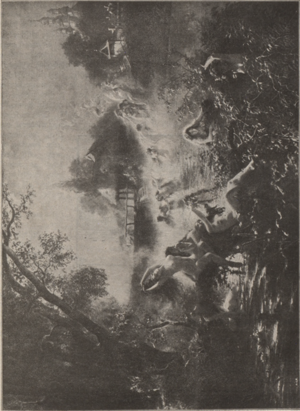
Набрас — Матюшка.