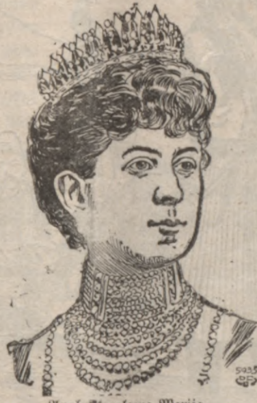
Angļu karaleene Marija.

Nē, jauna bija ari wina bijuse tāpat ka zitas, bet