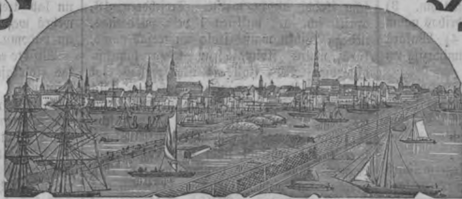
Mahjas Weefis iswahk weentis pa nedetu.

Makfa bes peesubstifcham Riga: Ar Peelikumu: par gadu 1 r. 75 L. bes Peelikuma: par gadu 1 " — " Ar Peelikumu: par 1/2 gadu — " 90 " bes Peelikuma: par 1/2 gadu — " 55 "