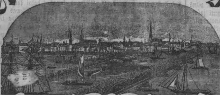
Mahjas Weefis isnahk weuceis pa nedesu.

Maksa ar peesubtischamu par pasi: Ar Peelikumu: par gadu 2 r. 35 f. bet Peelikuma: par gadu 1 " 60 Ar Peelikumu: par 1/2 gadu 1 " 25 bet Peelikuma: par 1/2 gadu " 5