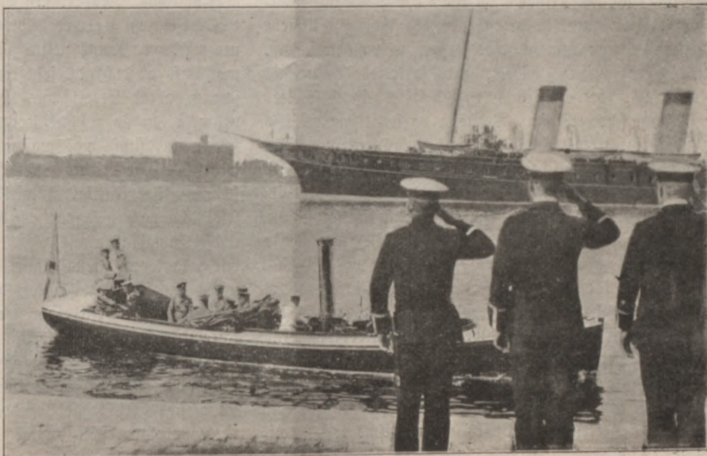
„Standarta“ peenahschana Nigā 3. juliā.

No wisa ta, ko Needra sawā ahreji noslihpeta runā, kuru tas ar teizameem balfs lihdselkeem un dauds weetās ar leelu patofu par tautisko jautajumu Sinibu Komisijas wasaras sapulzes itā kahdas noslehtas grupas