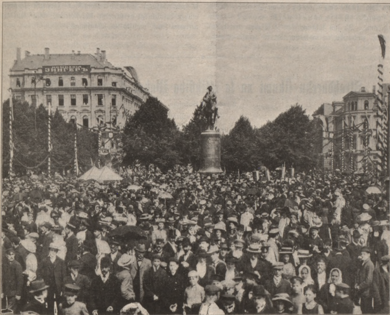
Štati if Rigaš jubilejas deenam: Petera Leelā veeminellis tuhlin pehž allahščanas.

flanojumu un uf pašchām beigam isdšifa tas labais eespaids, ko zittahrt no šchās Sinibu Komifšjas fapulzes katrs buhtu mantojis. Ja wakar dafchš aishahja neapmeerinats no fapulzem, tad titai zaur winu wadonu wainu. Ja mehš fur waram wišpufeji brihwi isteittees, tad tahdai weetai wajadsetu buht — Sinibu Komifšjas fapulzes. Tapehž nebija pareiši, ka fapulzes wadonis nehma wahrdū gimnifšjas skolotajom Pulpes kungam jo wairaf tamdehft, ka newareja buht schaubu par to, ka Pulpes lgs tā akademifski izglihtots zilweks fawus ušflatus daufš fmtu inteligentas