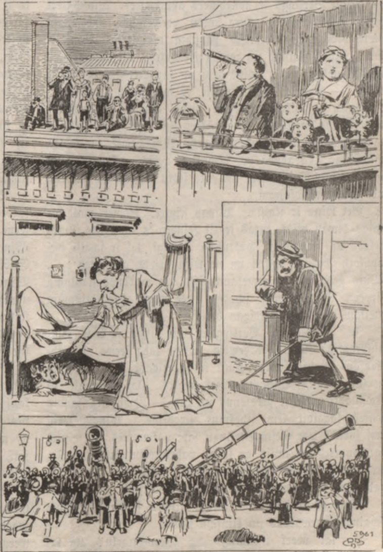
Ainas kometas nakti.

Krusttehws Kristofers stahw un druhmu flatu noluhkojas wißâ, kas sche noteef. Peepeschi winsch israu jehnischkigo wehstuli no peedurkes atrota un eemet leesmâs. Tit Deewam finams, to winsch pee tam domâ. Warbuht winam parahdas, ka pati grafeene Marta teef us fahrta fahedfinata, warbuht ari — ka us semes naw wairs neka