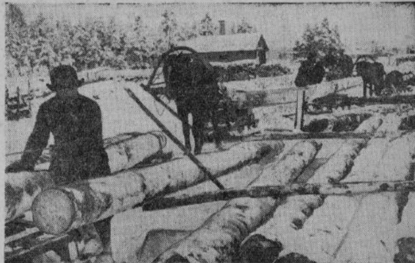
Ogres aprīnka Jumpravas pagasta zemnieki jau novembrī izpildīja kokmateriālu izvešanas plānu un tagad rosīgi piedalās kokmateriālu izvešanā. Atēlā: zemnieki izkrauj balķus Jumpravas stacijas krautuvē.