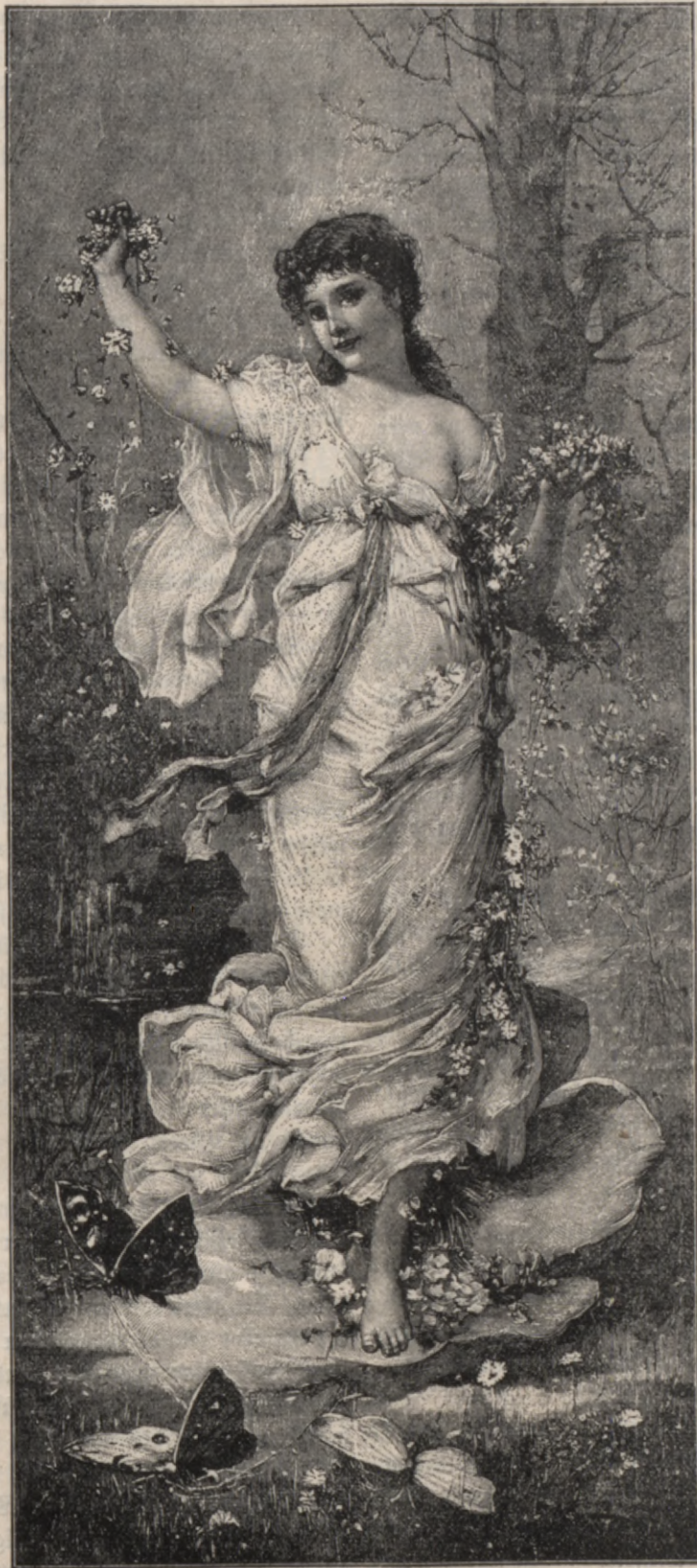
Pawafars — J. Bernarda.