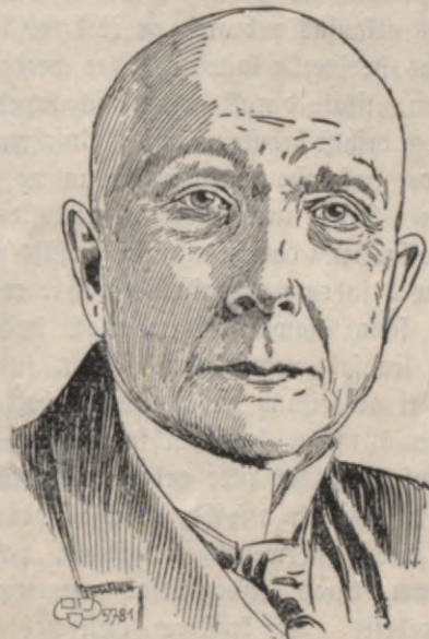
John D. Rockfellers.

Dascheem gan nepatika pehdejee wahrdi. Wezakeem kaudim tee litās k̄a Deewa faimoschna. Bet wifus aisku-