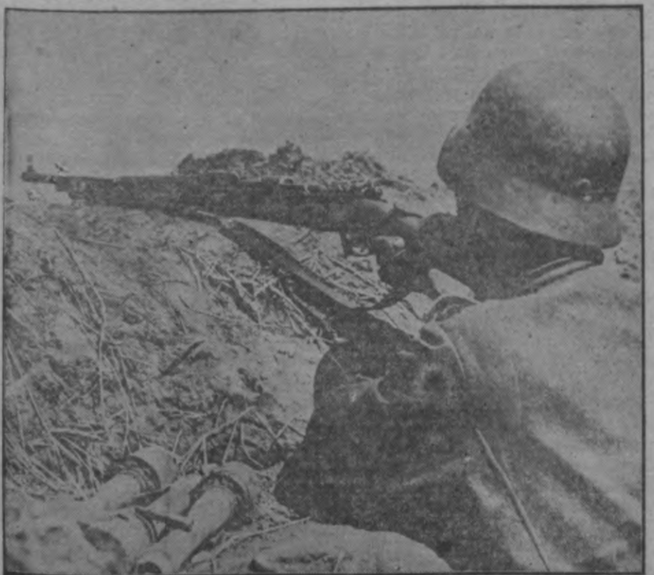
FRONTĒ PIE VORONEŽAS.

DNB. Stokholmā, 4. septembrī. Reitera aģentūra ziņo no Belfastas, ka piektdienas naktī mēģināts izspridzināt Randalts policijas kazarmes Antrimas grāfistē. Kādā bumba ar laika degli eksplodēja kazarmju tuvumā, nodarot zaudējumus tikai un levalnojot kādu policijas ierēdni.