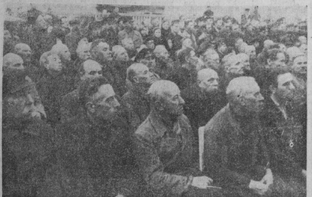
Svētku runu klausoties.