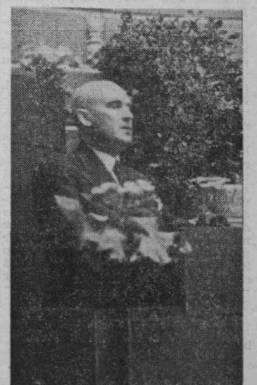
Ģenerāldirekciju ierēdņu un darbiniekus uzrunā ģenerāldirektors ģen. Dankers.