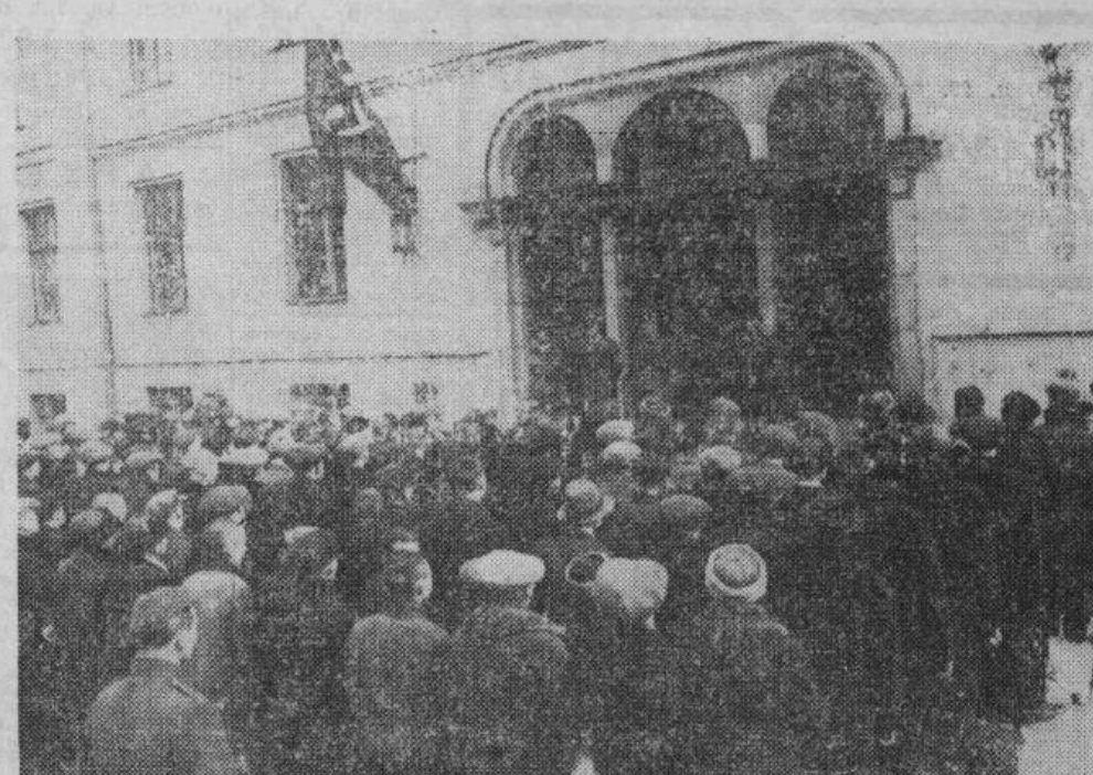
Pateicīgām sirdīm 1. maija rītā atbrīvotie politiskie uzskaita apgabala komisārs Fust'a paziņojumu, lai sāktu jaunu dzīvi.

cīgumu nesaskanošām metodēm, bet gan mēģinām viņus labot un uzvest uz pareizā ceļa. Jūs visi kā Vācijas Vadoņa lielā atbrīvošanas darba sabotētāji esat peinijuši, lai jūs izslēgtu no tautas kopības vismaz uz visu kara laiku. Ja nu tagad es jūs atlaistu no apcietinājuma un no jauna došu jums izdevību dzīvot brīvībā un nodoties jūsu profesijai un jūsu darbam, tad es to daru tikai sekojošu iemeslu dēļ: es sagaidu no jums, ka apcietinājuma laikā jūs esat atzinuši savu nokļūšanu uz aplamā ceļa, ka izcietis apcietinājuma laiks jums bijis par mācību, un ka jūs visi bez izņēmuma būsit jums tagad piešķirtās apzēlošanas cienīgi. Jūs paši tagad esat pārliecinājušies, ka drošības policija, darbojoties saskaņā ar tai piešķirtiem uzdevumiem un pavēlēm, atrod un soda ikvienu, kas grib iet kopēju ceļu ar bolševikiem. Mēs līdz šim neesam pielāvuši un arī nākotnē aizkavēsim to, ka ciņā pret pasaules ienaidnieku — bolševismu, pret kuru ta-