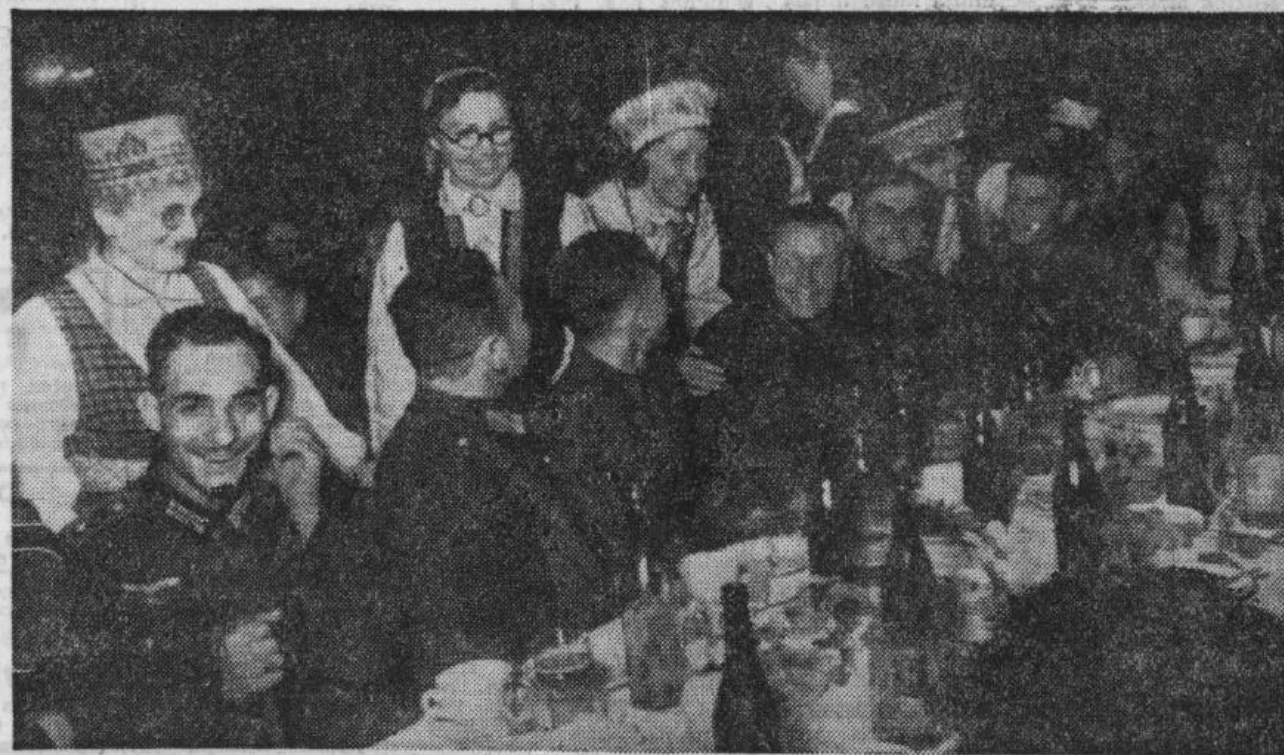
Skats Rīgas pilsētas lielvecākā Wittrock'a rīkotajā uzņemšanā vieglāk ievainotiem vācu, latviešu un spāņu kaņavīriem