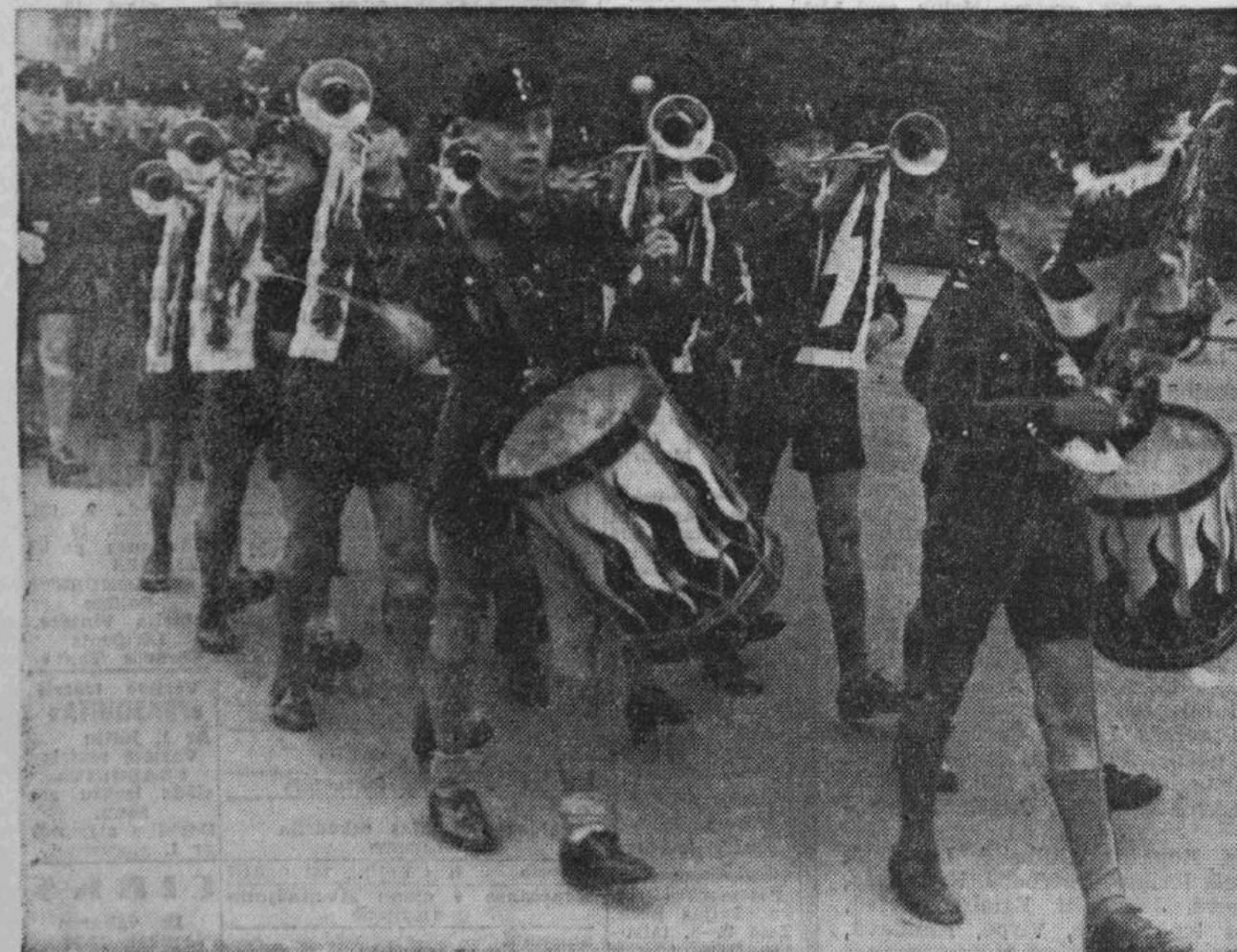
Adolfa Hitler'a Sonthofenas skolas audzēkņu orķestris 1. jūlijā rītā modina rīdziniekus.