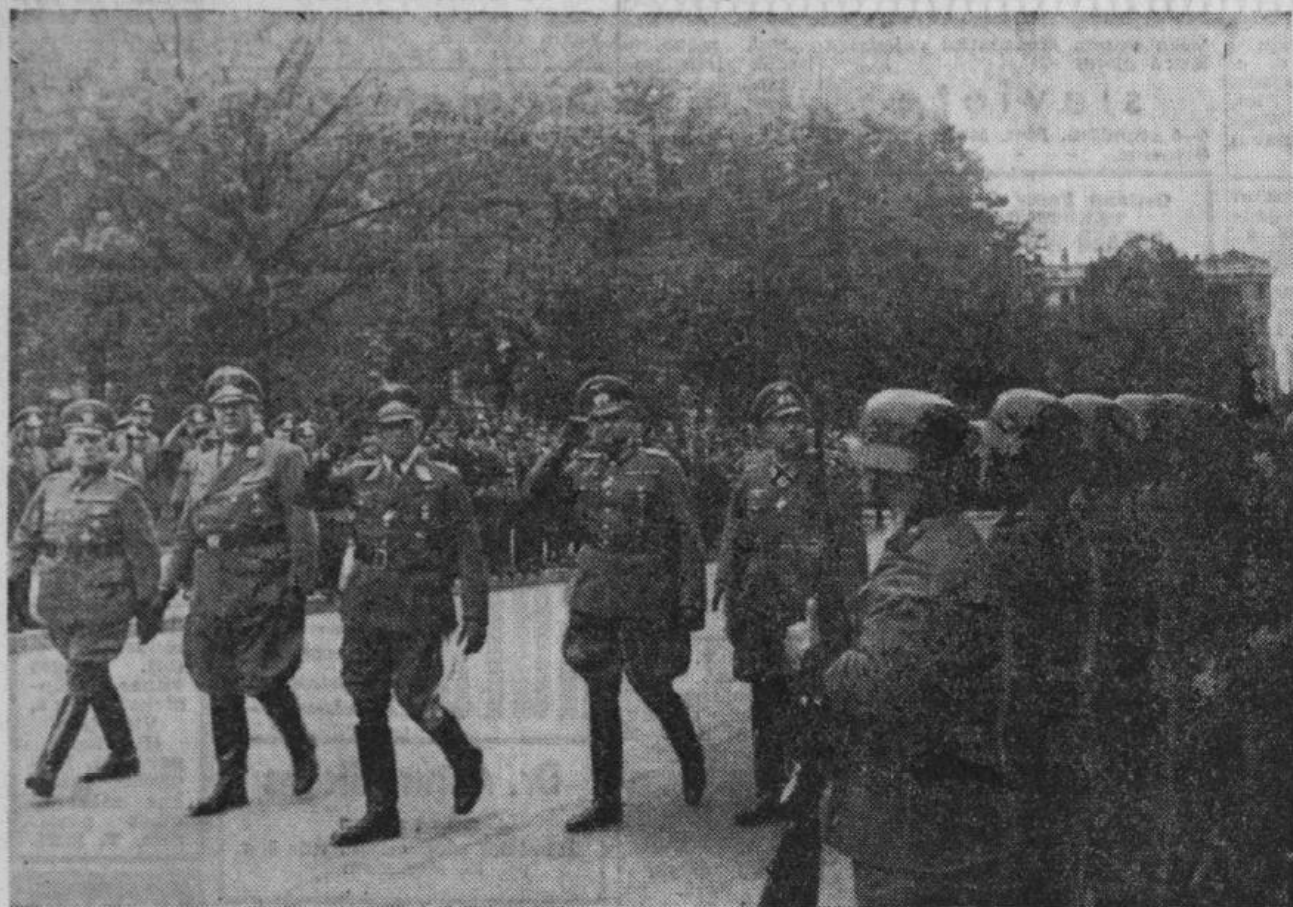
Kaņaspēka skate. Bruņoto spēku pavēlnieki un skates viesi sasveicinās ar kaņaspēka vienībām.