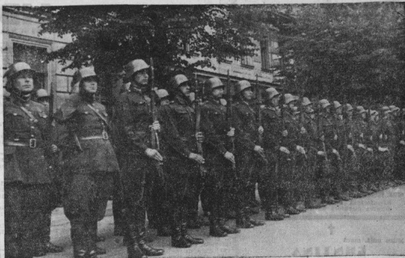
Latviešu brīvprātīgo vienība kaņaspēka skates ierindā.