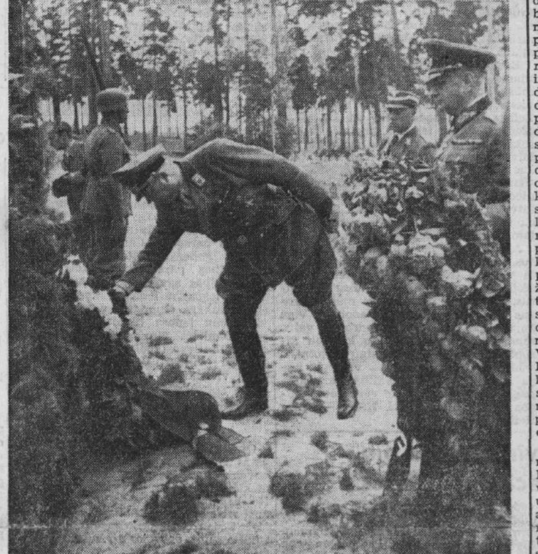
Atbrīvošanas dienas svinības Rīgā. Reichskomisārs Lohse noliek vainagu kritušajiem vācu kapavīriem. Blakus reichskomisāram — ģenerālkomisārs, valstspadomnieks Dr. Drechsler's un bruņoto spēku pavēlnieks.

līcī un Karaību jūrā 14 ienaidnieka tirdzniecības kuģus 98.000 brt koptilpumā un ar torpēdu trāpījumiem bojājot divus citus kuģus. Viena daļa no nogremdētiem kuģiem bija piekrauta ar lidmašīnām, municiju un citiem kara materiāliem, kas bija domāti Afrikai.