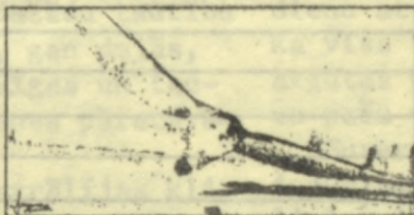
SNOWY OWL Aviation Symbol of Québec

The agreement will make it easier for a Québecer or an Ontarian to change his driver's licence if he settles in the other province. The provisions of the agreement will come into effect on April 1, 1989 .