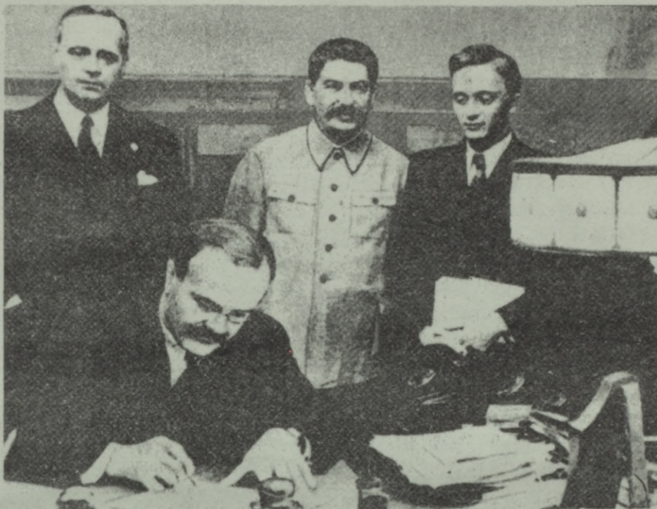
Soviet Foreign Minister Molotov signs the non-aggression pact in 1939. Behind him, from left: German Foreign Minister von Ribbentrop, Stalin and another Russian, U. Pavlov

Third, there is an original document of a German map of the eastern part of Central Europe on a scale of 1:1,000,000 (1cm = 10km) showing the demarcation of the German and Soviet spheres of influence as specified in the Secret Supplementary Agreement.